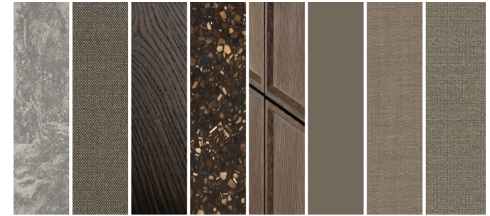
Moodboard materiaal- en kleurgebruik

Het karakter van het licht kan verschillen: het is hard en koel als het moet, zacht en vriendelijk als het kan. En wie weet bepaalt de verlichting straks de toon van het debat.