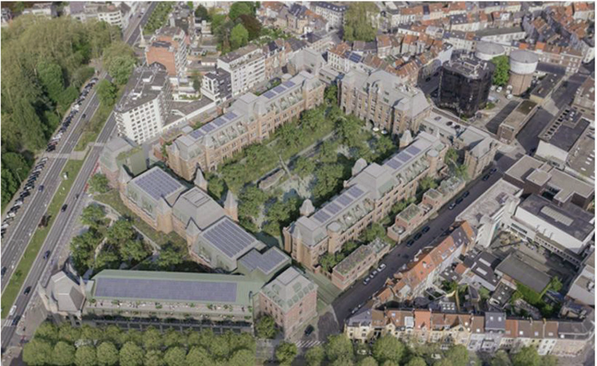
3D © Joris Bourgeois