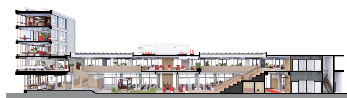
Dwarsdoorsnede van het werklandschap van Basecamp