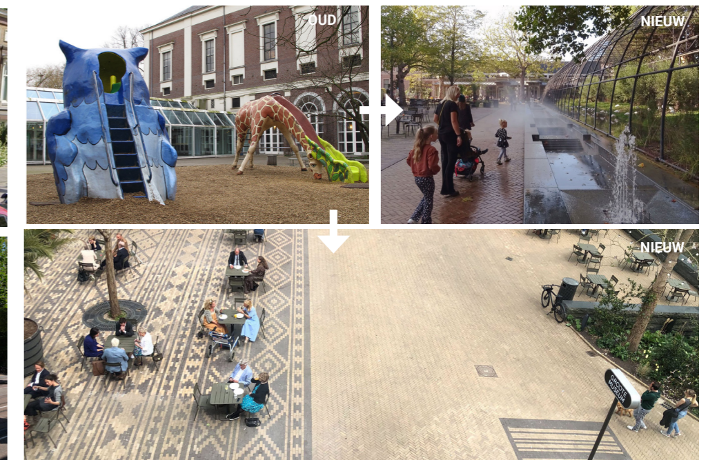
Figuur 13. In het masterplan ARTIS 2030 is voorgesteld om de 19 eeuwse gebouwen aan de rand van ARTIS consequent te voorzien van een geveltuin en het hek weg te halen ('gebouw = hek'). De straat vergroent hierdoor en oogt vriendelijker, het levert een bijdrage aan de klimaatadaptatie en de gebouwen komen als het ware in de tuin te staan: de tuin loopt door tot aan de straat, in plaats van dat de tuin pas begint aan de achterzijde van de stadspaleizen van Groot Museum, ARTIS Bibliotheek of Aquarium. Boven: bibliotheek, onder: Groot Museum. Ontwerp: H+N+S Landschapsarchitecten