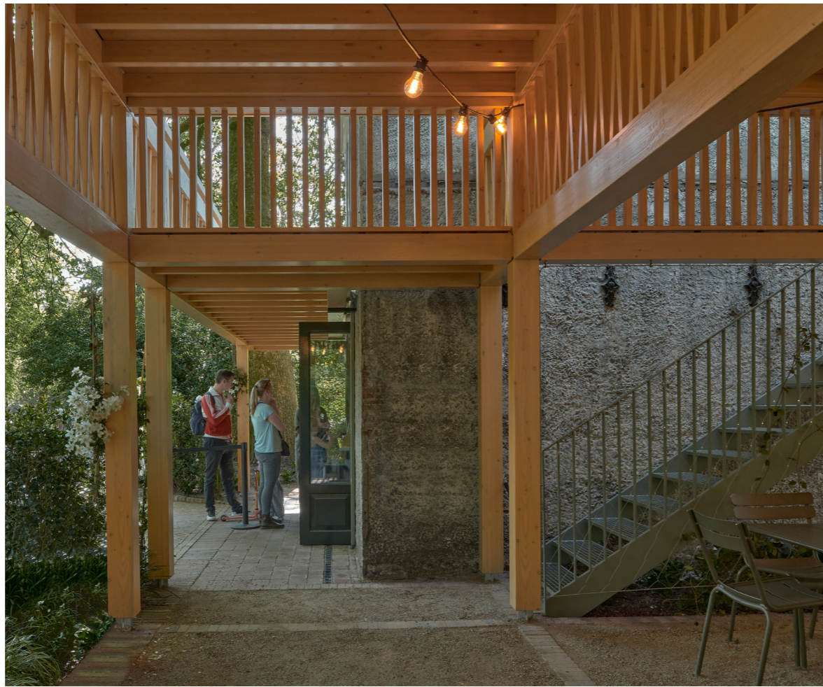
Figuur 5. Aan het monumentale Duivenhuis is door Atelier Front een -reversibele- houten constructie toegevoegd die deels dak is voor het overdekte horecaterras en deels balkon voor het vergaderzaaltje op de 1e etage

Ondanks dat er de laatste jaren al veel is gebeurd en veel is bereikt zijn er nog steeds onafhankelijke en kwalitatief ondermaats delen te vinden op ARTIS. Met name in de achtertuin is nog sprake van een zeer onlogische routing en is nog niet overal de ARTIS-klinker toegepast. Daarnaast staan er door het hele park prachtige monumentale gebouwen die momenteel onbenut blijven. In ieder geval de begane grond zou overal een publieke functie moeten huisvesten. Daarvoor moet de bezoeker nog even geduld hebben. Maar op 13 juni 2026 kan de bezoeker het nieuwe Aquarium zelf zien en beoordelen of het het predikaat 'Meesterrestauratie' verdient.