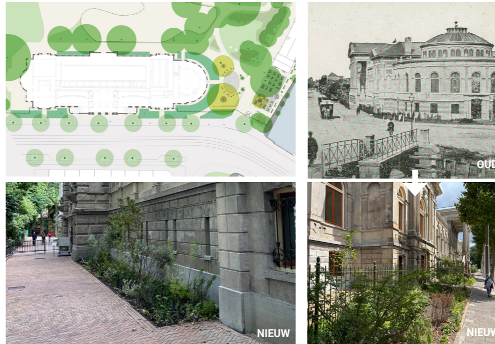
Figuur 9. De omgeving van het Aquarium wordt geheel vernieuwd: in de eerste fase aan de voorzijde is de verharding zo aangelegd dat regenwater in de aanliggende groenvakken kan infiltreren. Ook zijn groenstroken aan de straatzijde terugbracht, voor het beeld en als wadi's voor wateropvang - ontwerp: H+N+S