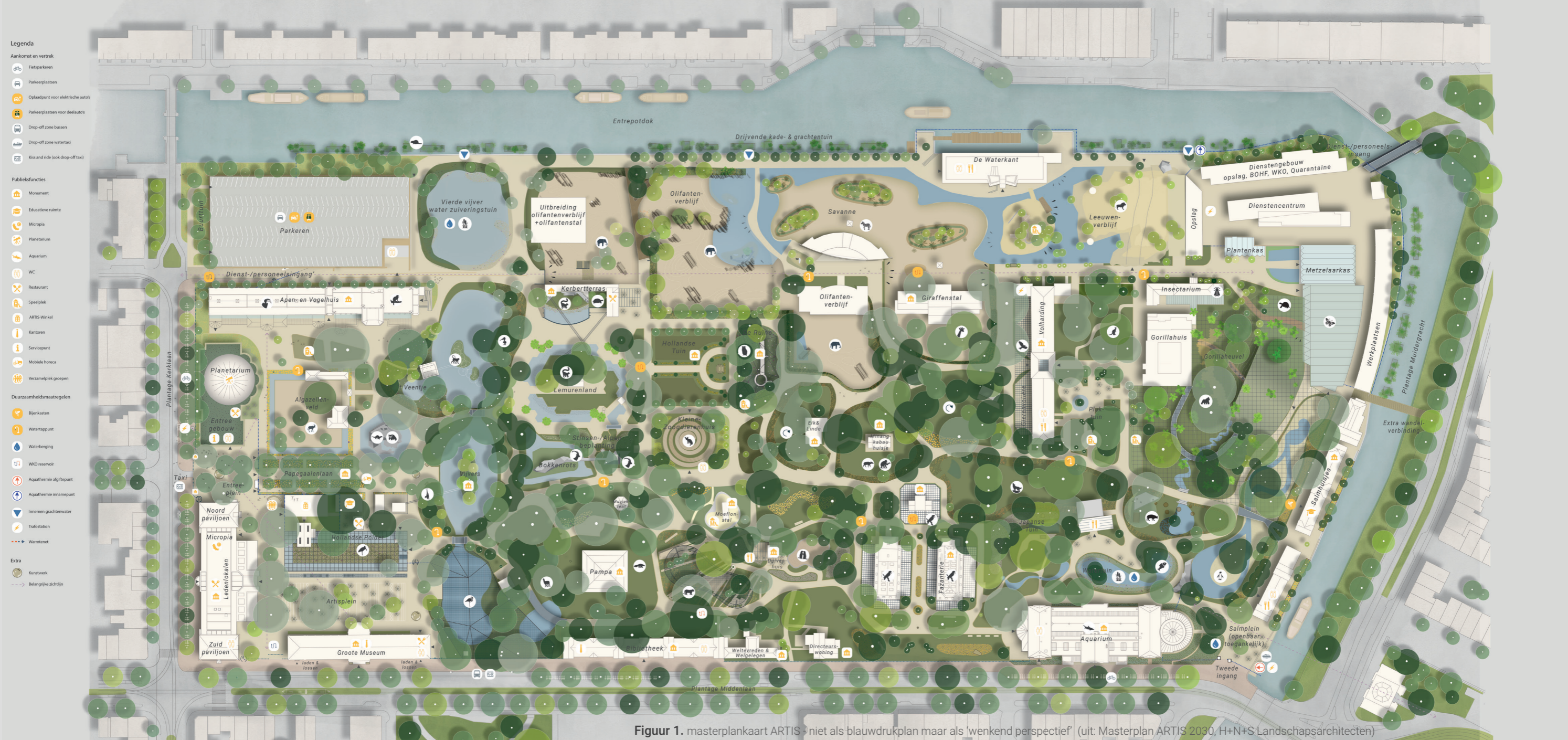
Figuur 1. masterplankaart ARTIS - niet als blauwdrukplan maar als 'weekend perspectief' (uit: Masterplan ARTIS 2030, H+N+S Landschapsarchitecten)

TRANSFORMATIE OP GEBIEDSNIVEAU: ARTIS bestaat al meer dan 180 jaar, en is als stadspark sterk vervlochten met de stad Amsterdam. Het verrees in 1838 in de Plantagebuurt, waar het tot een romantische 19e-eeuws park uitgroeide en een broeiplaats werd voor natuur en cultuur. Steeds veranderende nieuwe opvattingen over de relatie mens - natuur deed de dieren aantallen eerst fors toenemen om in de 21e eeuw juist weer af te nemen. Maar ook deed de tijd paden verspringen, werden verblijven vergroot en werden nieuwe gebouwen gerealiseerd die soms ook weer werden gesloopt. Kortom, het ARTIS park is eigenlijk altijd in beweging.