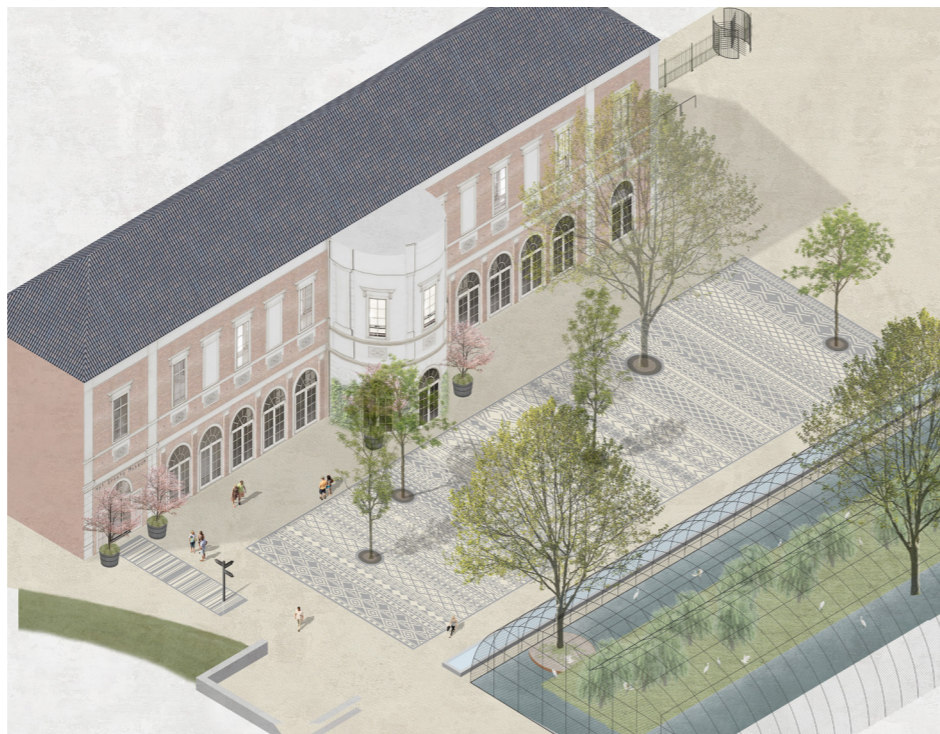
Figuur 2. Ontwerpvisual vernieuwd Artisplein (Michael van Gessel / H+N+S Landschapsarchitecte., met de nieuwe entree v/h gerenoveerde Groot Museum (Merk X)

Er wordt hierbij steeds op meerdere borden tegelijk geschaakt, en gewerkt aan vernieuwing van de tuin op korte en langere termijn.