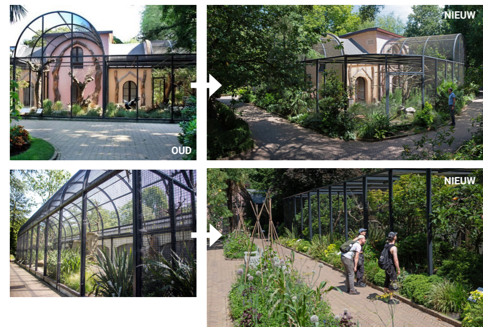
Figuur 12. In de tuin van ARTIS was er tot voor kort een heel harde scheiding tussen het merendeel van de verblijven en de paden met de bezoekers. De paden tot tegen de verblijven zorgden voor overlast voor de dieren, wat vanuit dierenwelzijn ongewenst is. Door een smalle groenstrook te ontwerpen is een drieklapper gerealiseerd: 1. het groenperk houdt bezoekers op 'afstand en geeft zo de dieren meer privacy, 2. het groenperk loopt visueel door waardoor het hek minder opvalt en minder leesbaar is als kooi, het verblijf is nu mooi groen 'afgebied' en 3. het 'tegelwippen' is onderdeel van de strategie van ARTIS voor duurzaamheid en klimaatadaptatie. Ontwerp: ARTIS/H+N+S Landschapsarchitecten