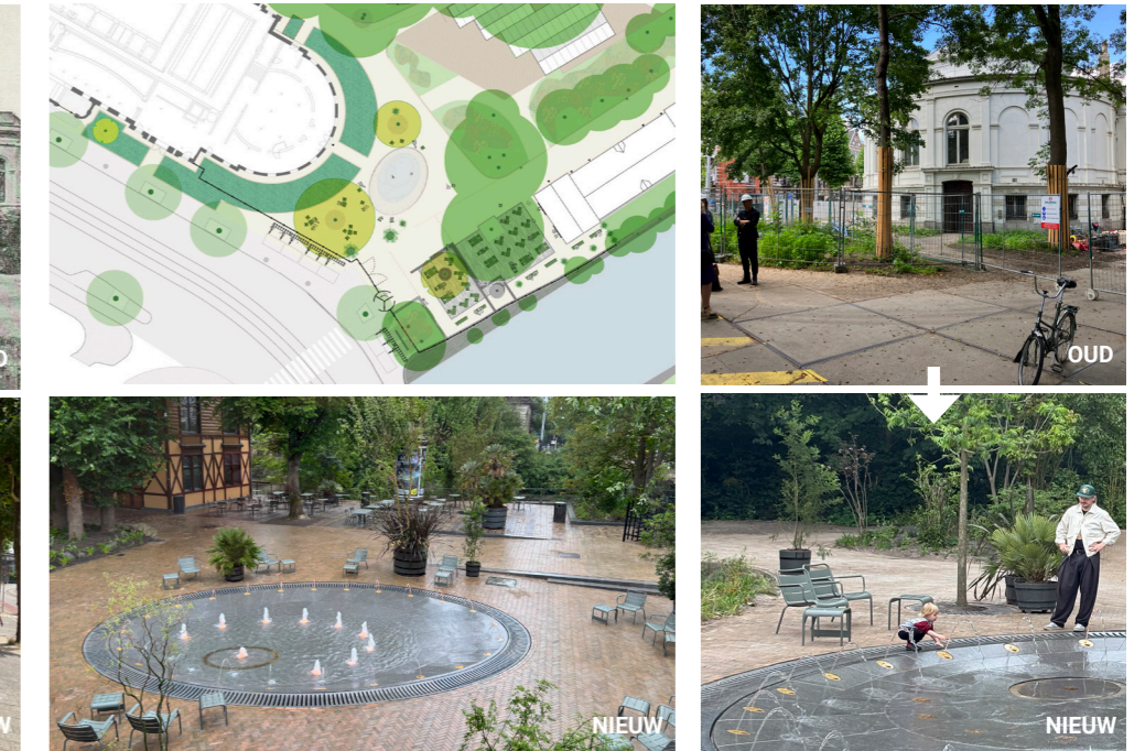
Figuur 10. De omgeving van het Aquarium is geheel vernieuwd, het Salmplein met zijn nieuwe fontein is de attractie in de achtertuin waar in toekomst zich ook horecaterrassen aan de Plantage Muidergracht zullen vestigen. - ontwerp: H+N+S