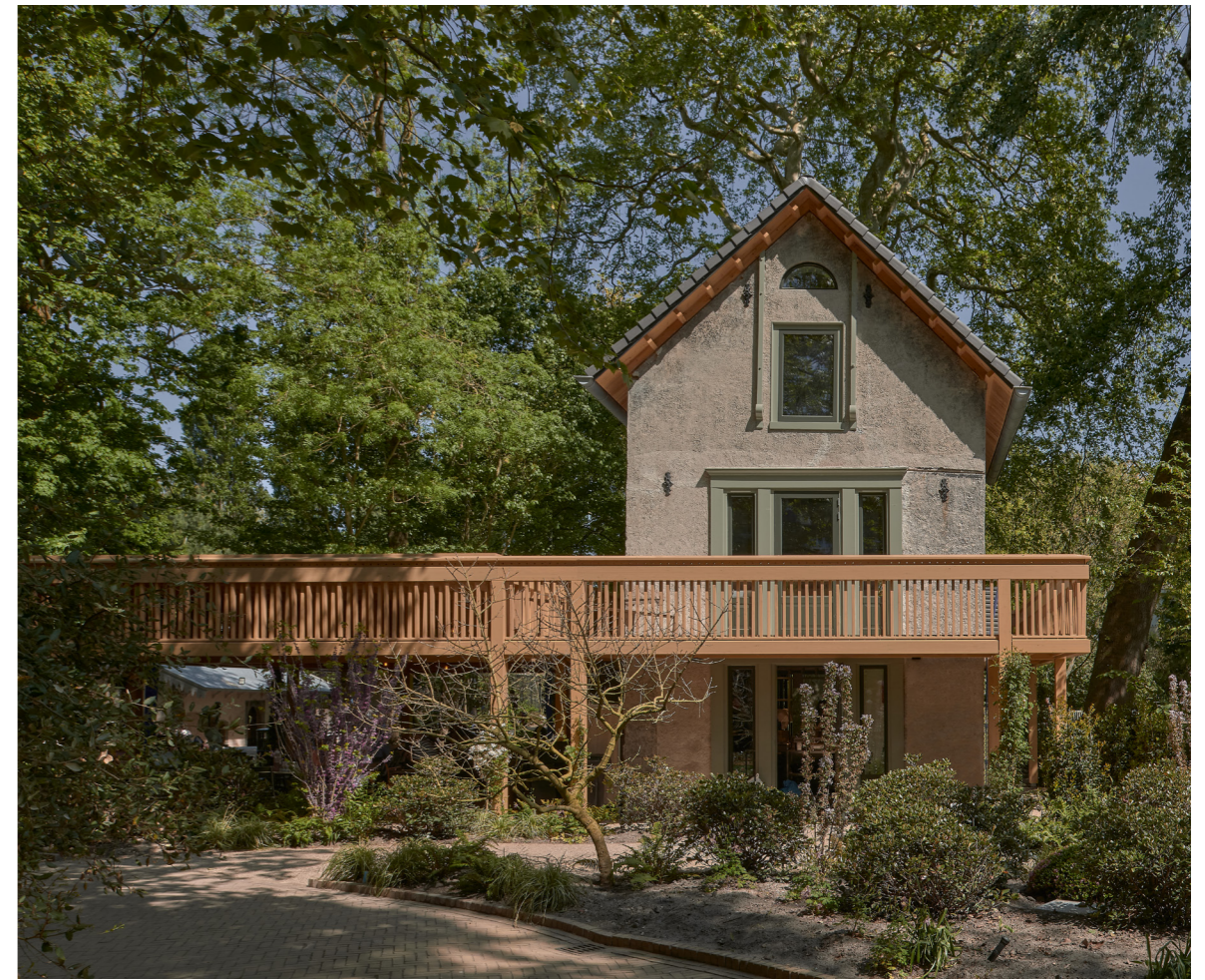
Figuur 6. Het voormalige Duivenhuis heeft nu een functie als poffertjestent (BG) en vergaderlocatie (boven); de houten constructie verwijst naar de historische situatie - ontwerp: Atelier Front i.s.m. H+N+S // foto: Max Hart Nibbrig