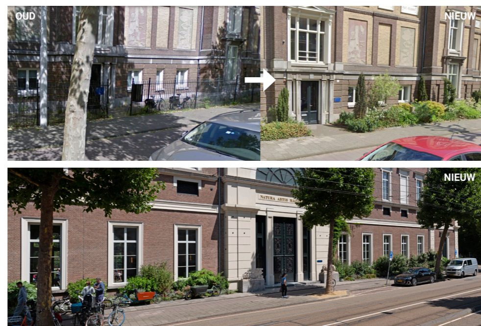
Figuur 11. In het masterplan ARTIS 2030 is voorgesteld om de 19 eeuwse gebouwen aan de rand van ARTIS consequent te voorzien van een geveltuin en het hek weg te halen ('gebouw = hek'). De straat vergroent hierdoor en oogt vriendelijker, het levert een bijdrage aan de klimaatadaptatie en de gebouwen komen als het ware in de tuin te staan: de tuin loopt door tot aan de straat, in plaats van dat de tuin pas begint aan de achterzijde van de stadspaleizen van Groot Museum, ARTIS Bibliotheek of Aquarium. Boven: bibliotheek, onder: Groot Museum. Ontwerp: H+N+S Landschapsarchitecten