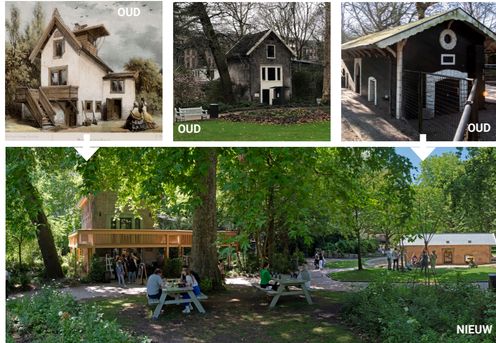
Figuur 8. De voormalige Moeflonstal en het naastgelegen Duivenhuis - beide een rijksmonument - stonden jaren leeg omdat ze niet meer voldeden. In 2025 zijn beiden getransformeerd en hebben een functie voor het publiek gekregen // ontwerp: H+N+S Landschapsarchitecten) foto: Hans van der Meer (2025)