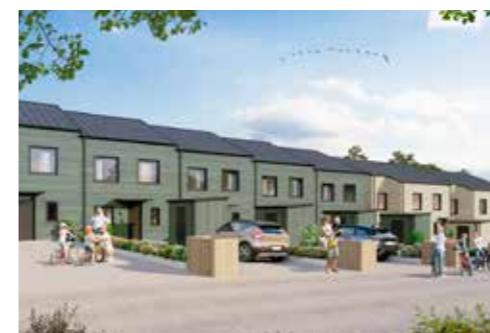
ALEN / B1 5 RUM OCH KÖK OM 125 KVM

För att du ska slippa kånka långt med dina matkassar och träningsväskor ger vi varje hus två parkeringsplatser i nära anslutning till entrén.