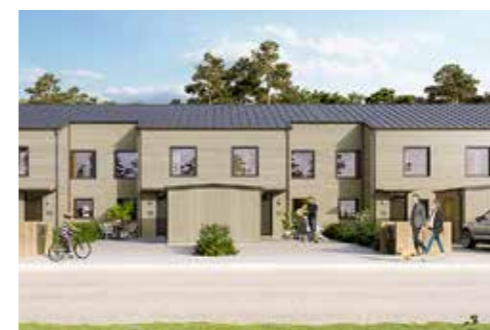
EKEN / B2 5-6 RUM OCH KÖK OM 131 KVM