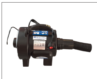
1515010 Electrisk handpump