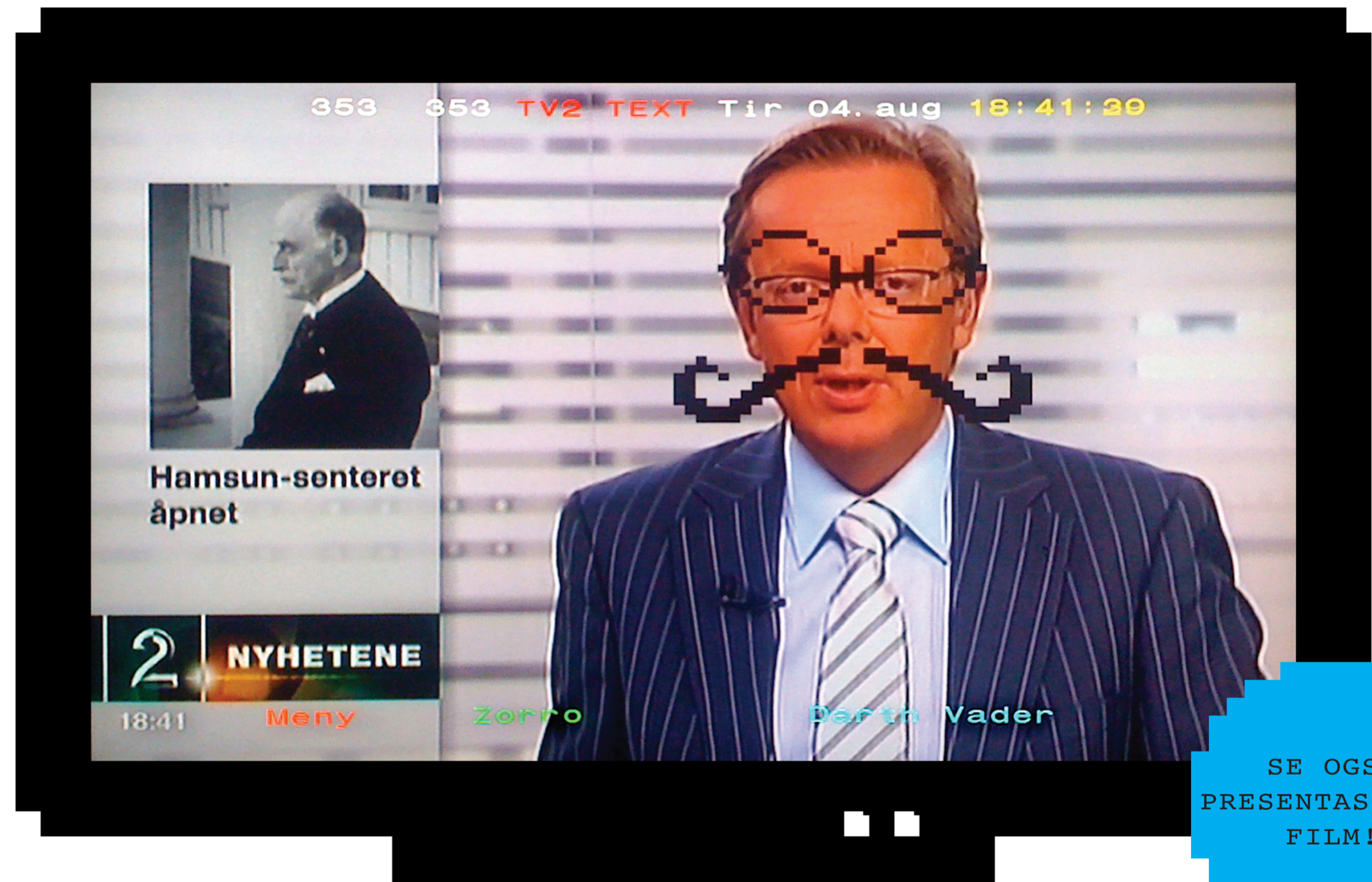
- Med fjernkontrollen kunne man både bytte og flytte motivene over skjermen