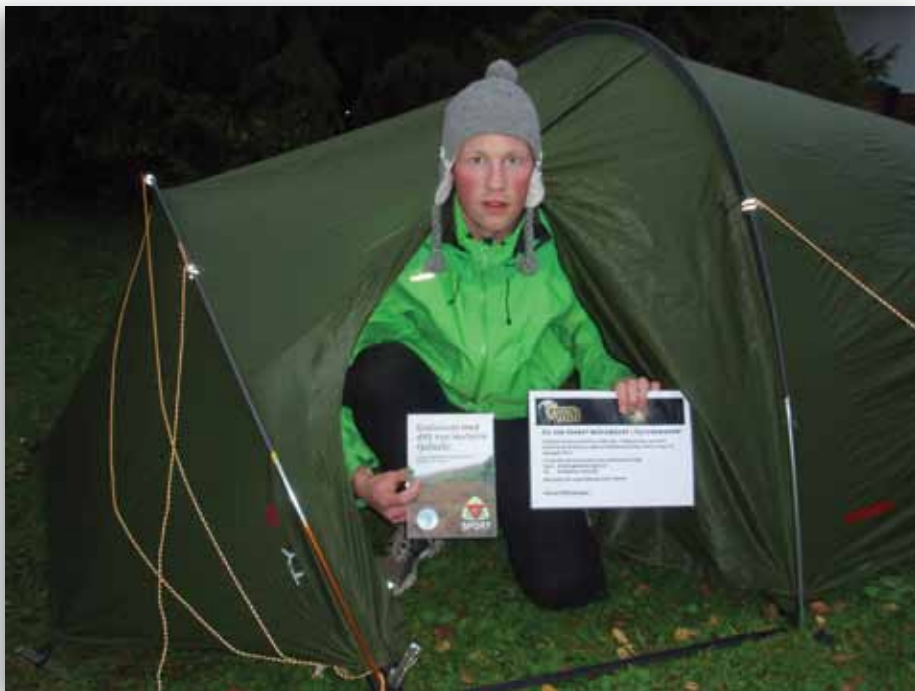
Vinnerne av Skiforeningens Finn & Vinn-kanpanje