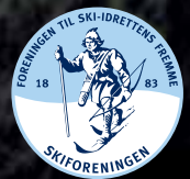
Skiforeningens Finn & Vinn annonse

På to steder i Marka står det nå splitter nye telt. Inne i teltene er det to ryggsekker. Og i ryggsekkene er det gratis Familie-medlemskap i Skiforeningen og varme luer. Men hvor er teltene? Hver dag i hele høstferien legger vi ut nye hint på Skiforeningens side på Facebook, som leder frem til stedene der teltene er. Den som finner det først, vinner det. Lykke til!