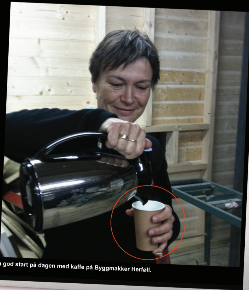
En god start på dagen med kaffe på Byggmakker Herføll.

Følg med på flere avsløringer på www.hemmeligetjenester.no og i neste utgave av BM.