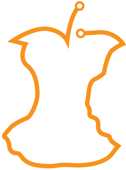
THE MATAVFALL LINE