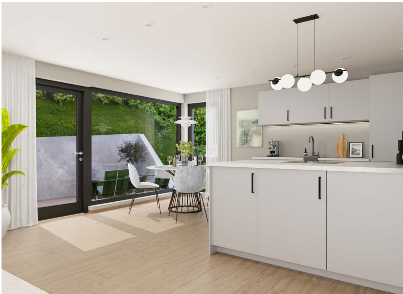
Interiøret er kun ment som illustrasjon og kan avvike.