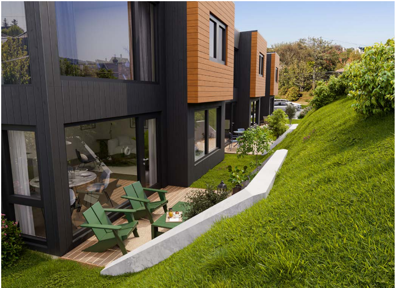
På baksiden får alle boligene en terrasse og noe hage.