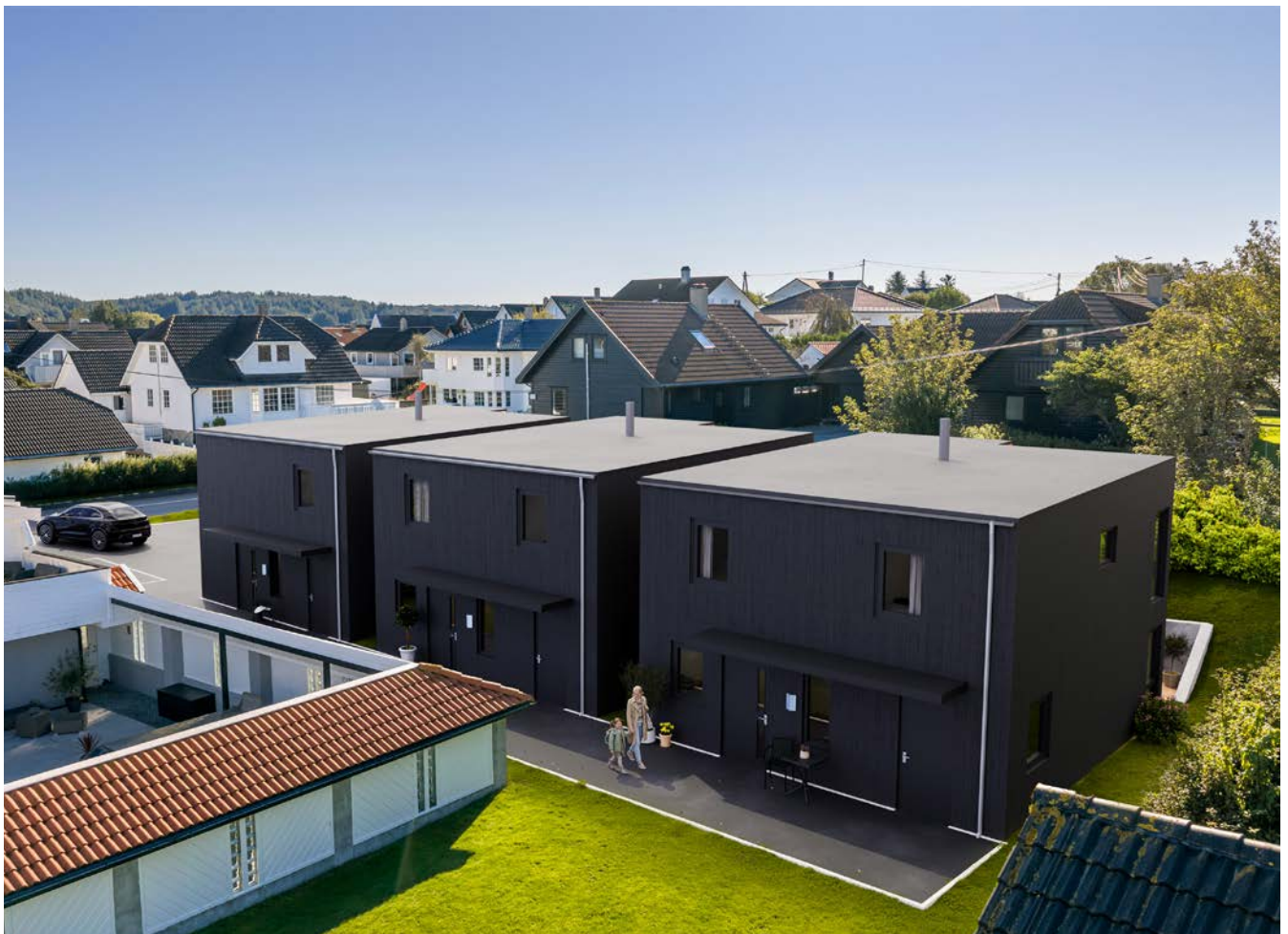
Løsningene er gjennomtenkt og tilrettelagt for enkelt og lite vedlikehold.