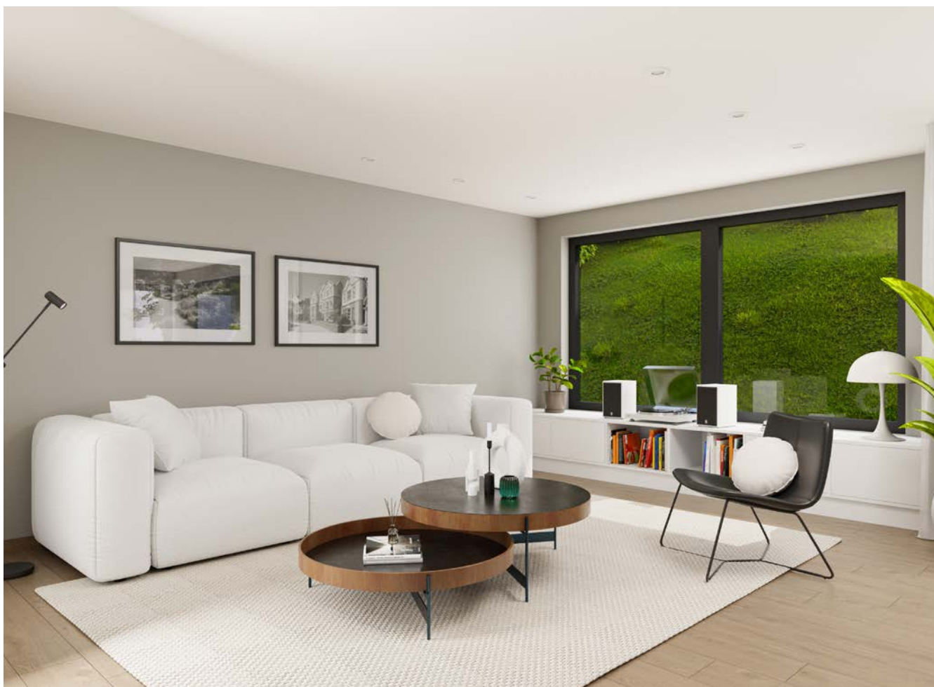
Interiøret er kun ment som illustrasjon og kan avvike.