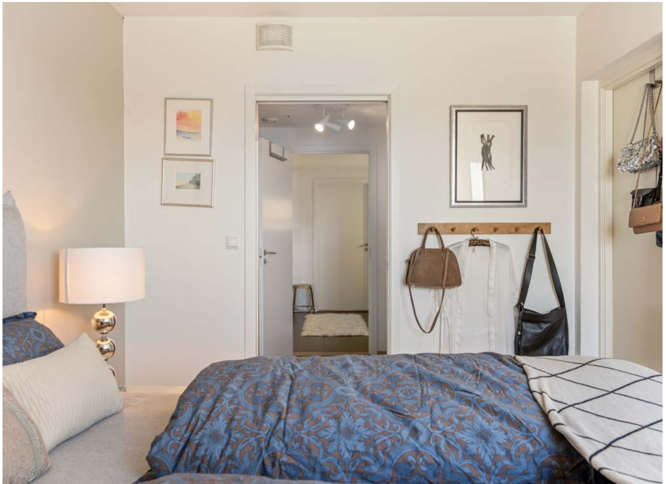
Hovedsoverom inn til garderobesrom og videre til bad