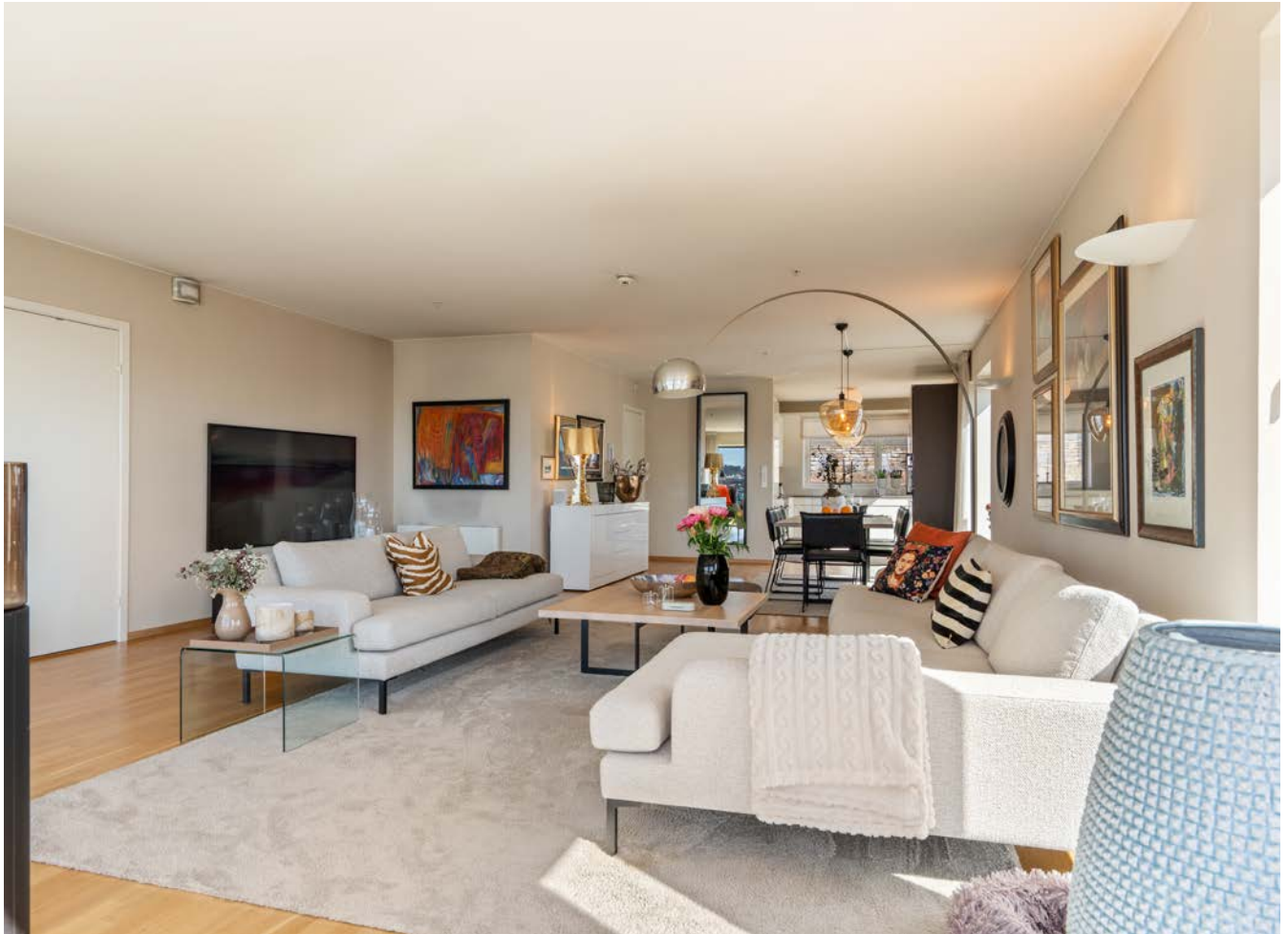
Utsnitt stue og spisestue og kjøkken helt i bak-kant