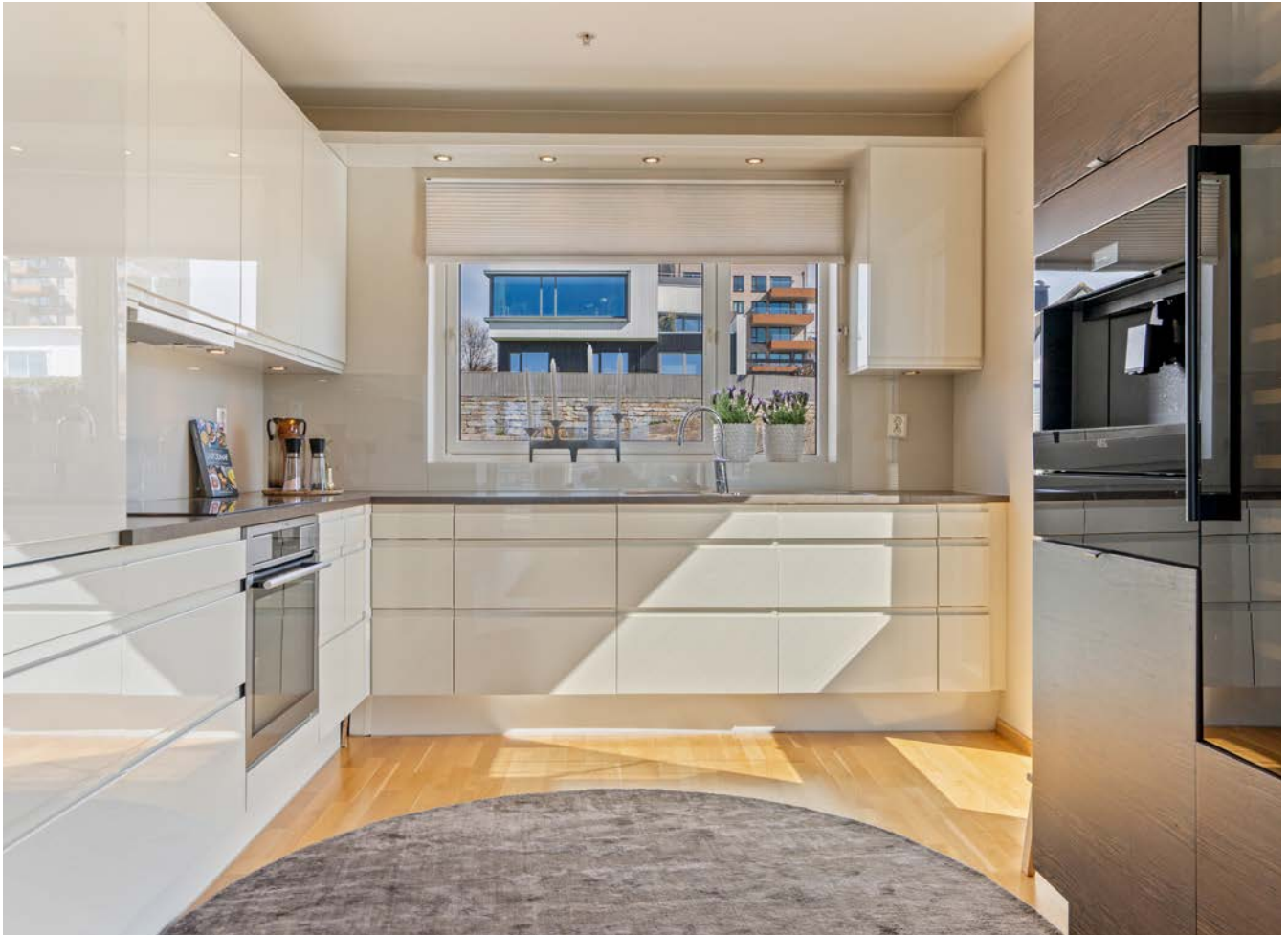
Del av kjøkkeninnredning m/integrerte hvitevarer. Ny Miele oppvaskmaskin.