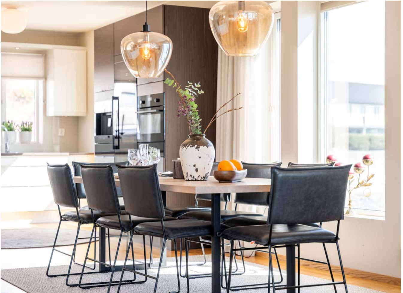
Kjøkkenbord/spisebord i lyse omgivelser.