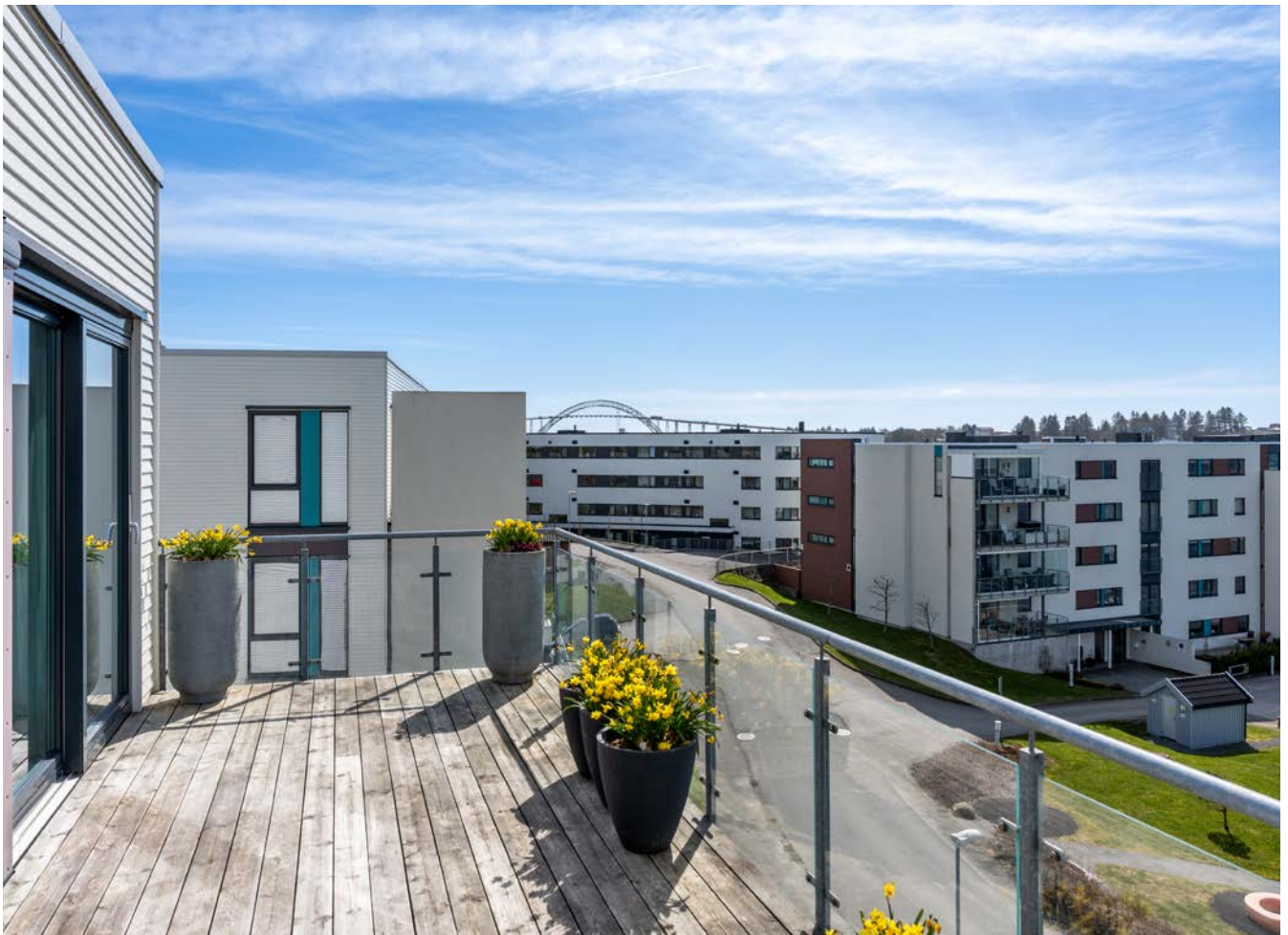
Del av terrasse mot sør