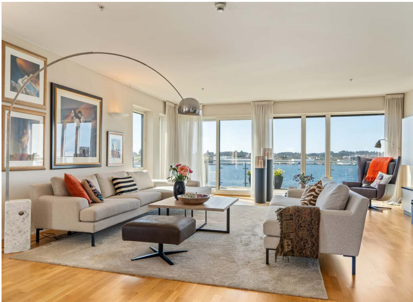
Sitter i stuen og får følelsen av å være på båt