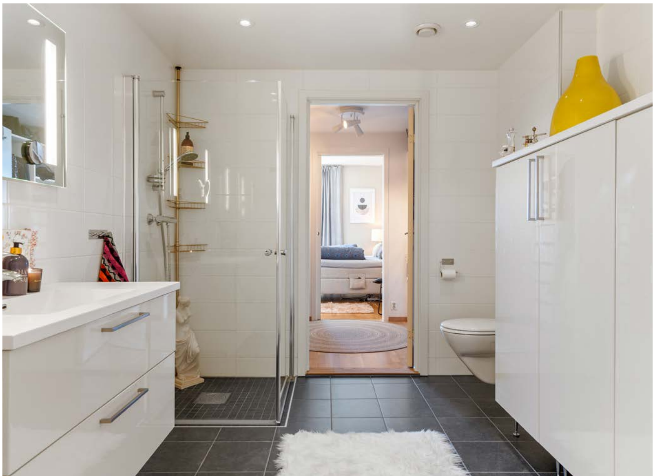
Utsnitt bad m/rikelig med skaplass.