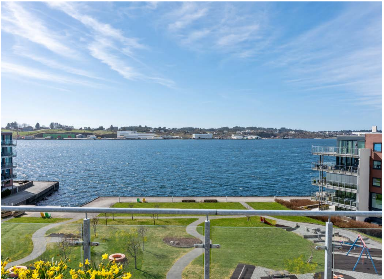
Fra terrassen med parkanlegget foran