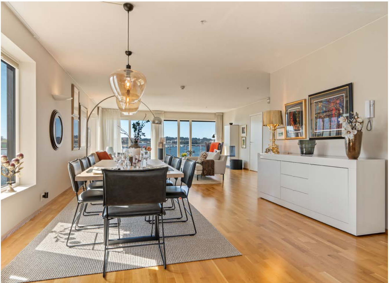
Gjennomgående leilighet med lys og Karmsundet inn.