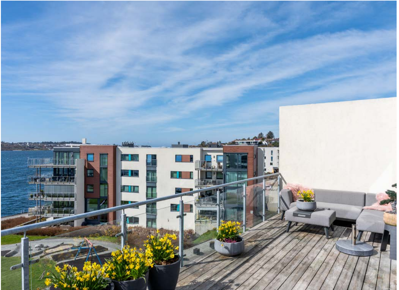
Del av terrasse me lè mot nord