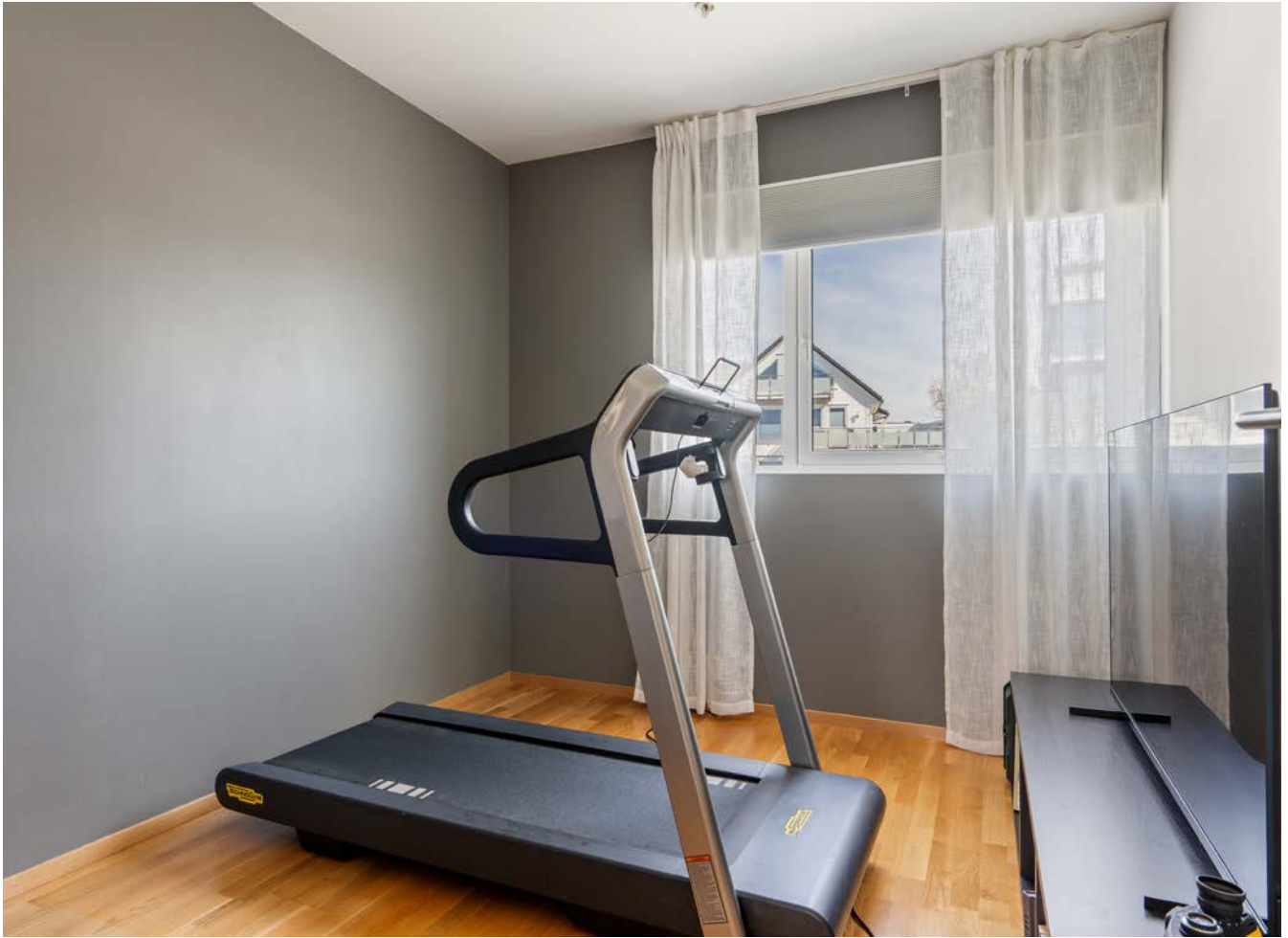
Soverom 2 eller "Boost-treningsrom"