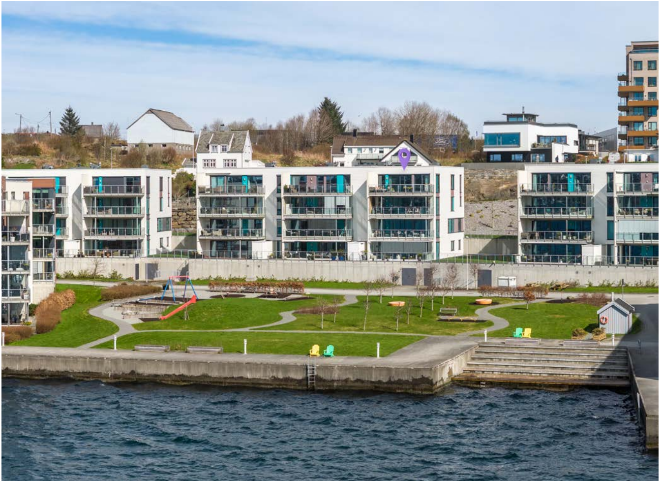
Toppetasjen i hjørne, parkanlegg og badeplass