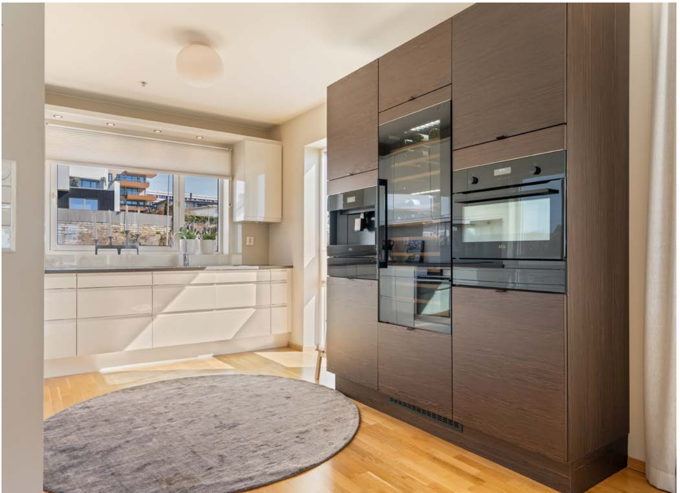
Kostbar ekstra-seksjon med integrerte hvitevarer. Varmeskuff, vacumskuff, kaffemaskin, stort vinskap og micro/stekeovn.