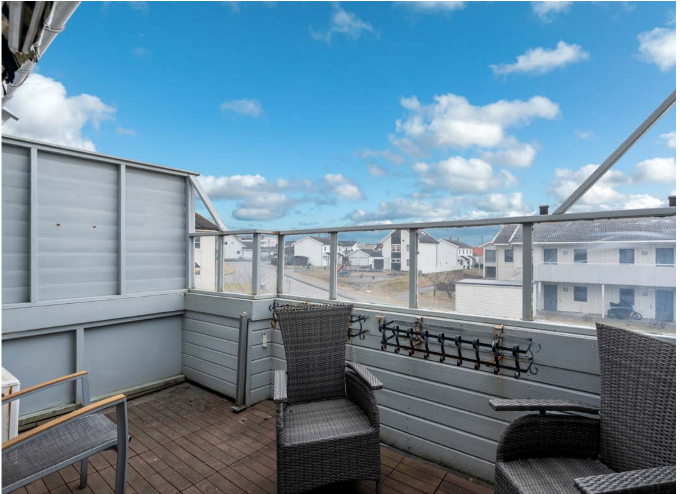
Hyggelig terrasse med plass til sittegruppe.