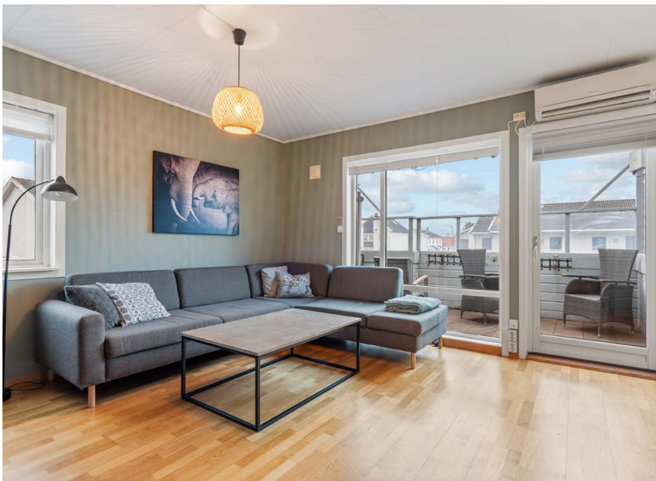
Leiligheten er malt i delikate farger.