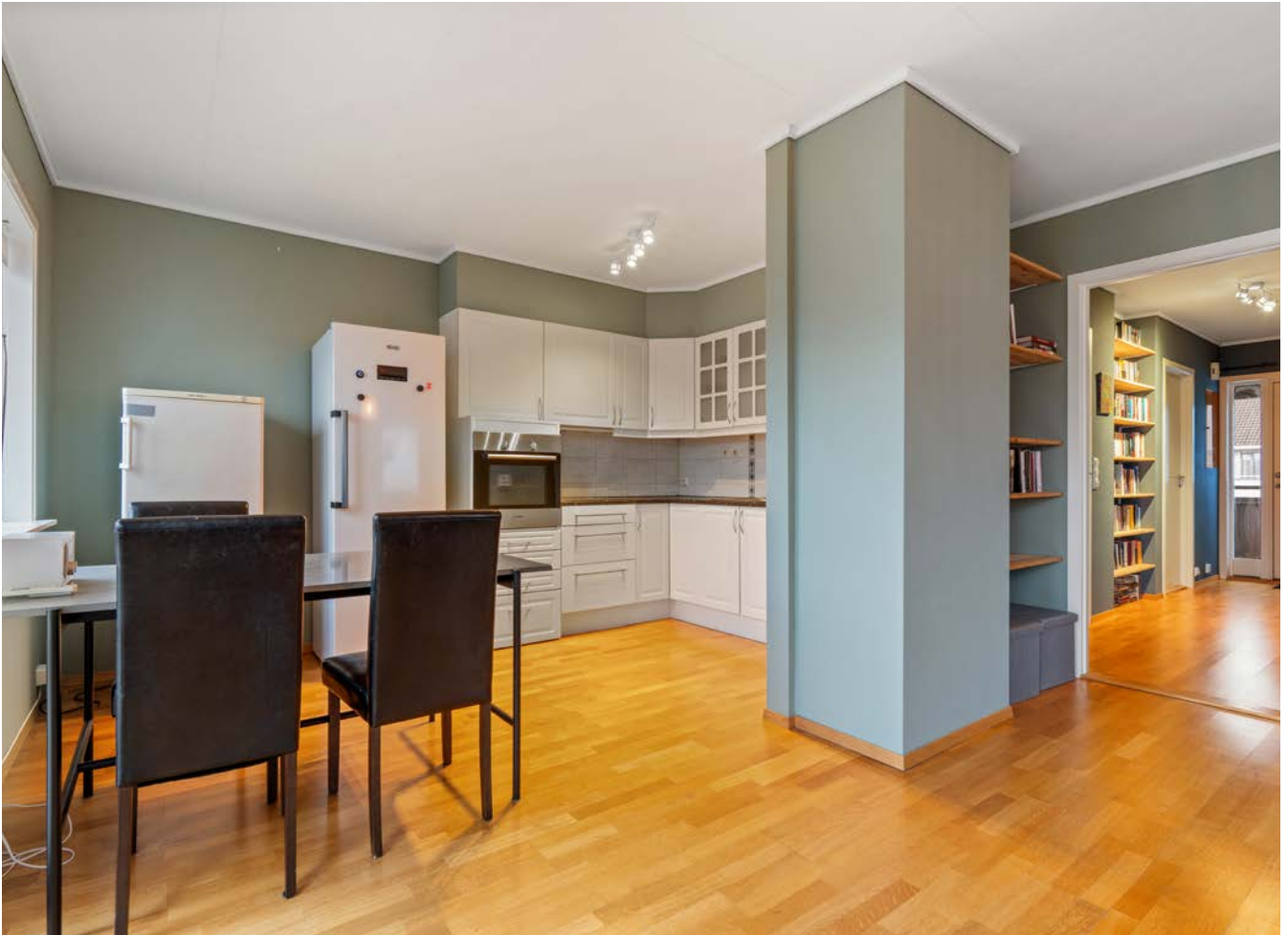
Praktisk åpen stue- og kjøkken løsning.