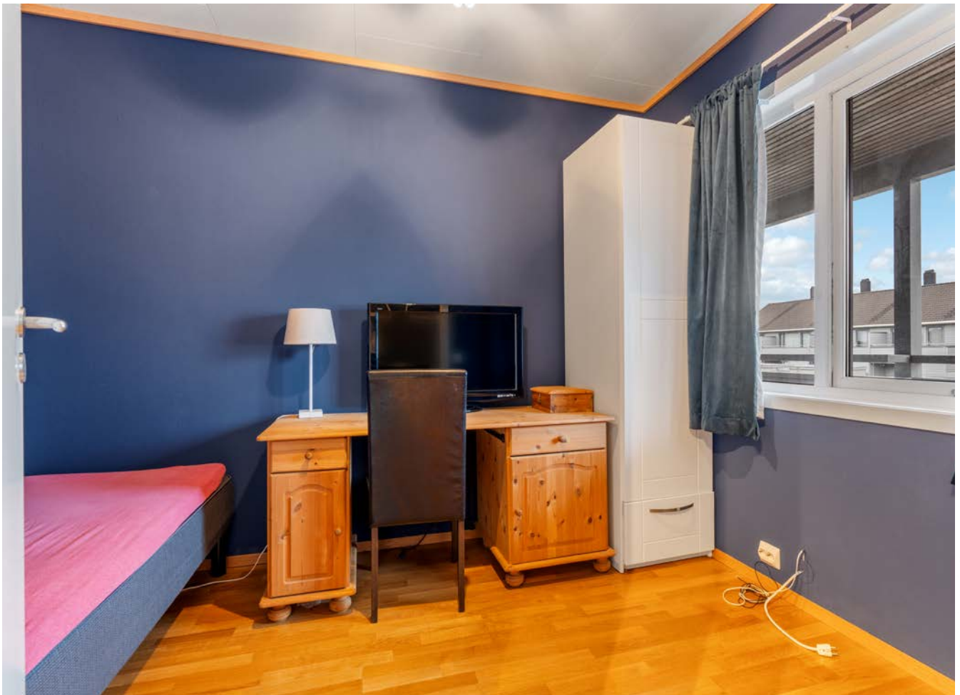
Soverom 2. Passer også godt som kontor, gamingrom m.m.