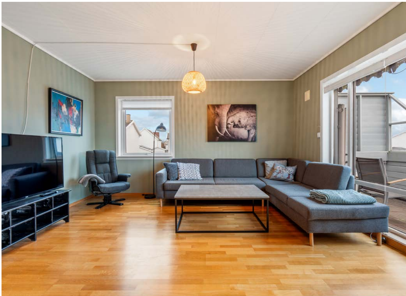
Innbydende stue med store vindusflater.