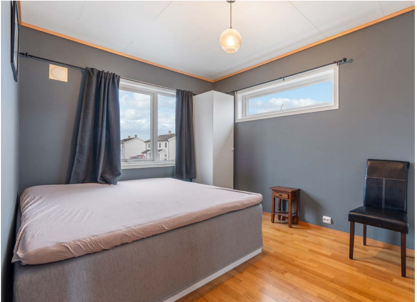
Hovedsoverom med god plass til dobbeltseng, klesskap og ønsket møblement.