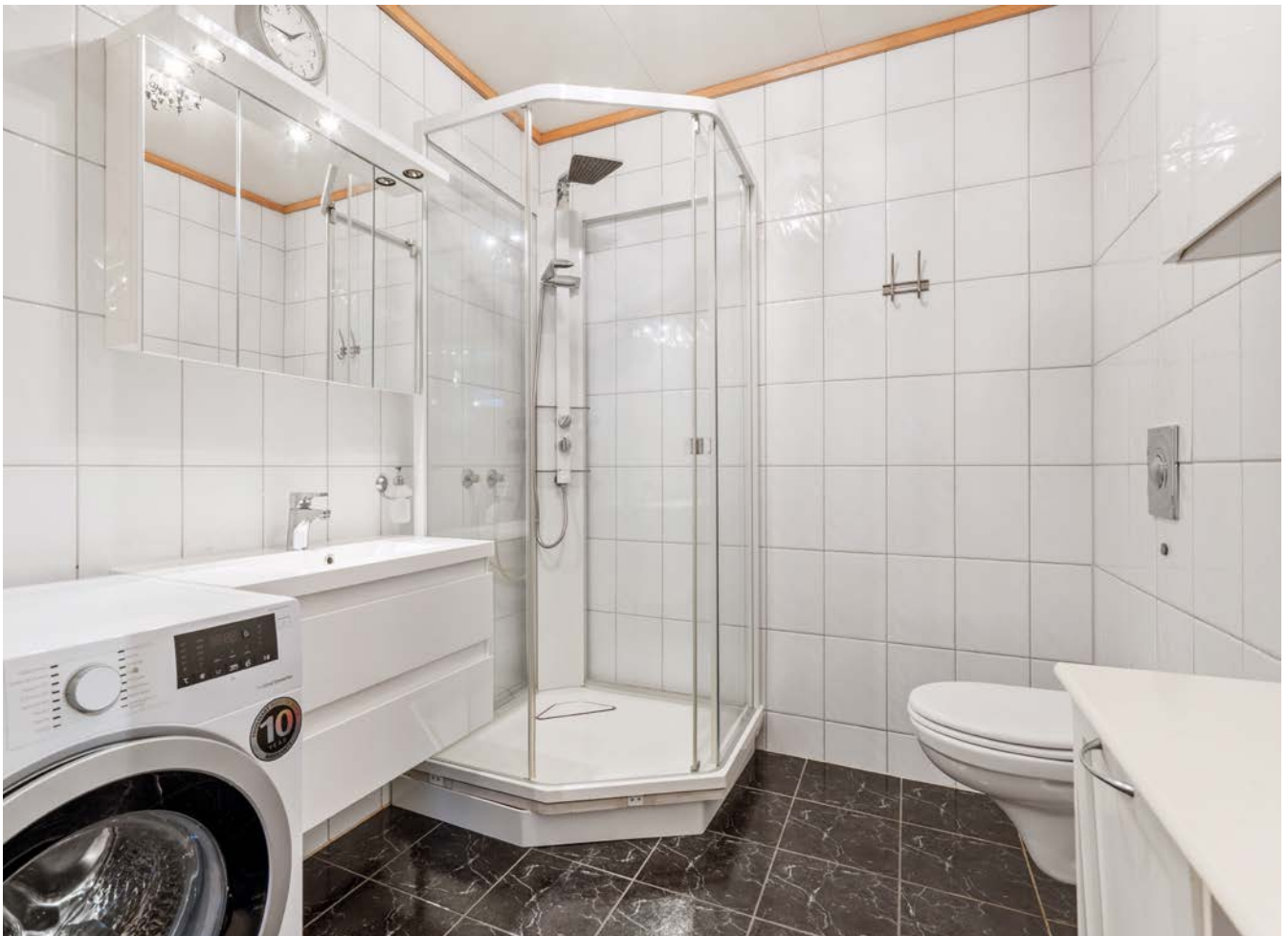
Lyst og fint bad av god størrelse.