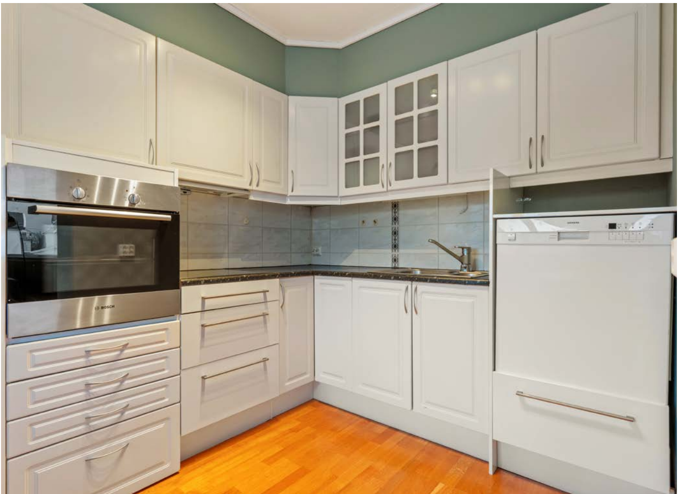
Lyst kjøkken med god skaplass. Oppvaskmaskinen medfølger ikke handelen.