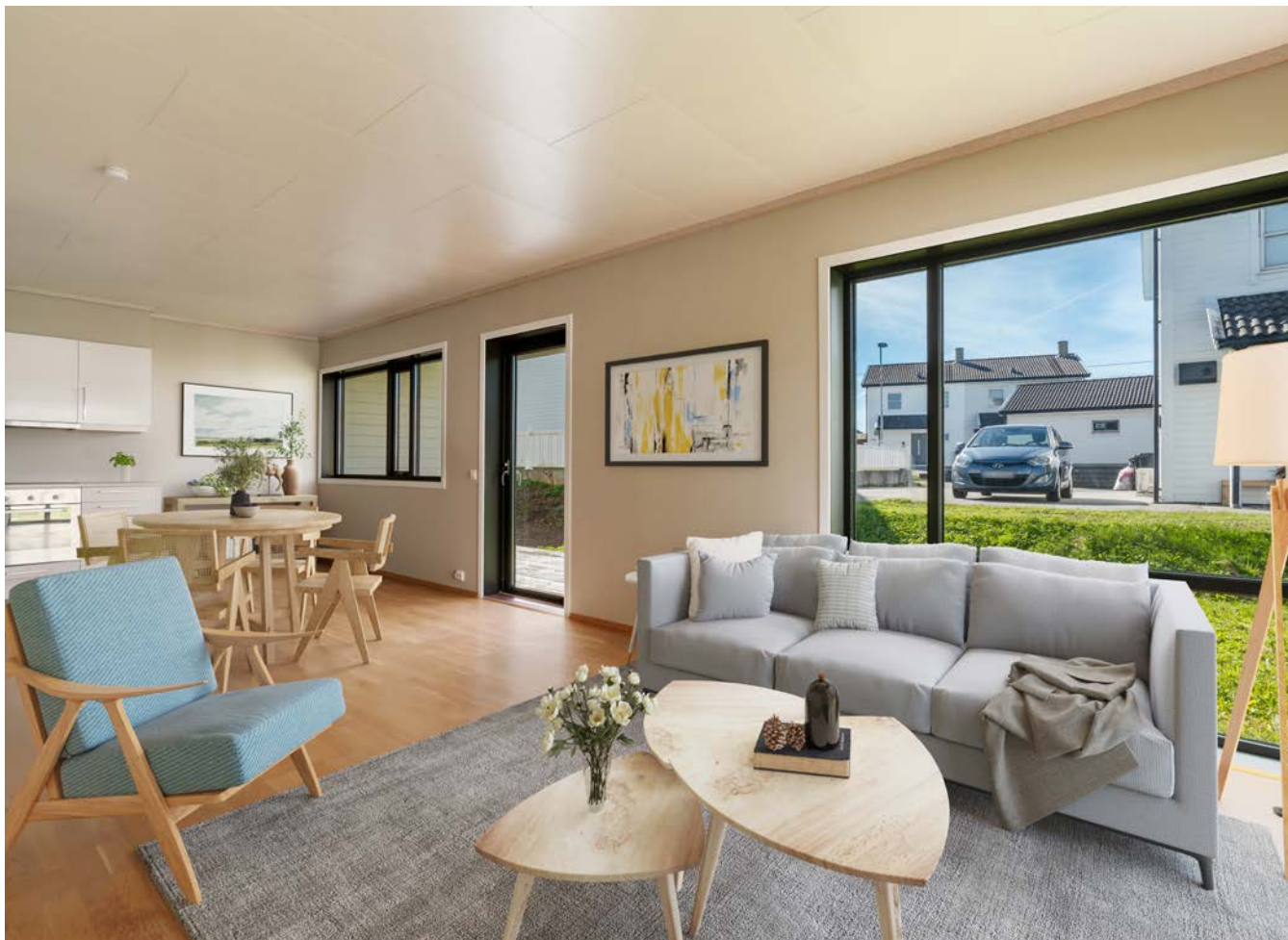
Digitalt møblert stue