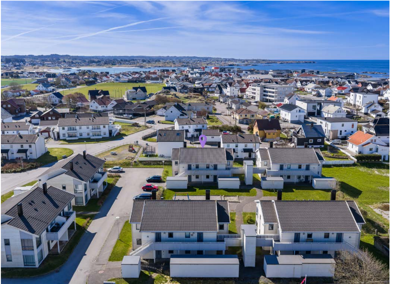
Kort rusletur bort til Åkrasand