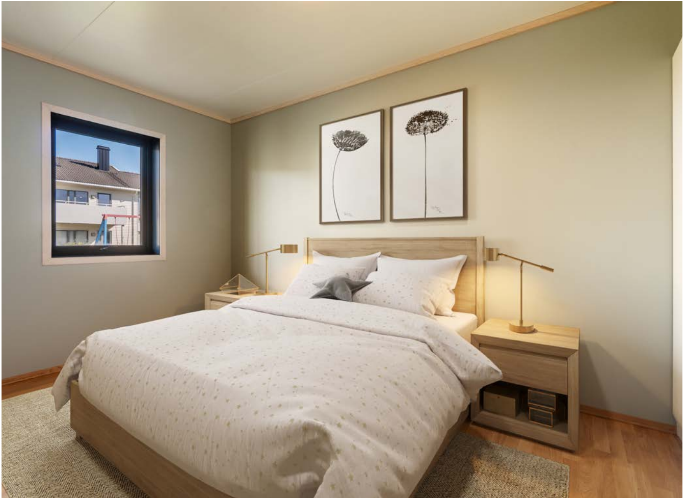
Digitalt møblert hovedsoverom. Rikelig med skaplass