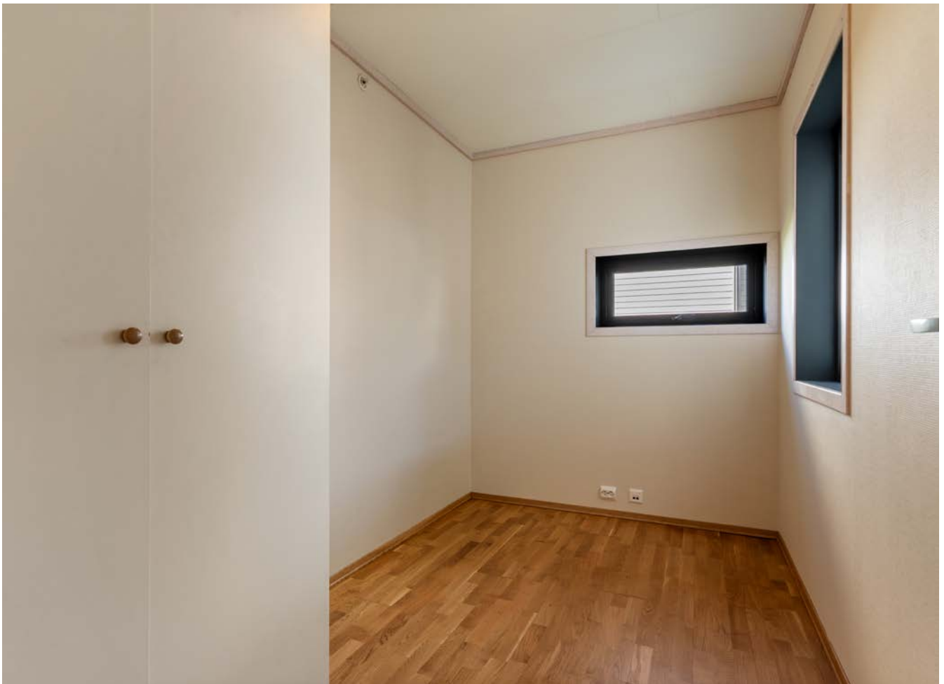
Soverom 2 med skaplass