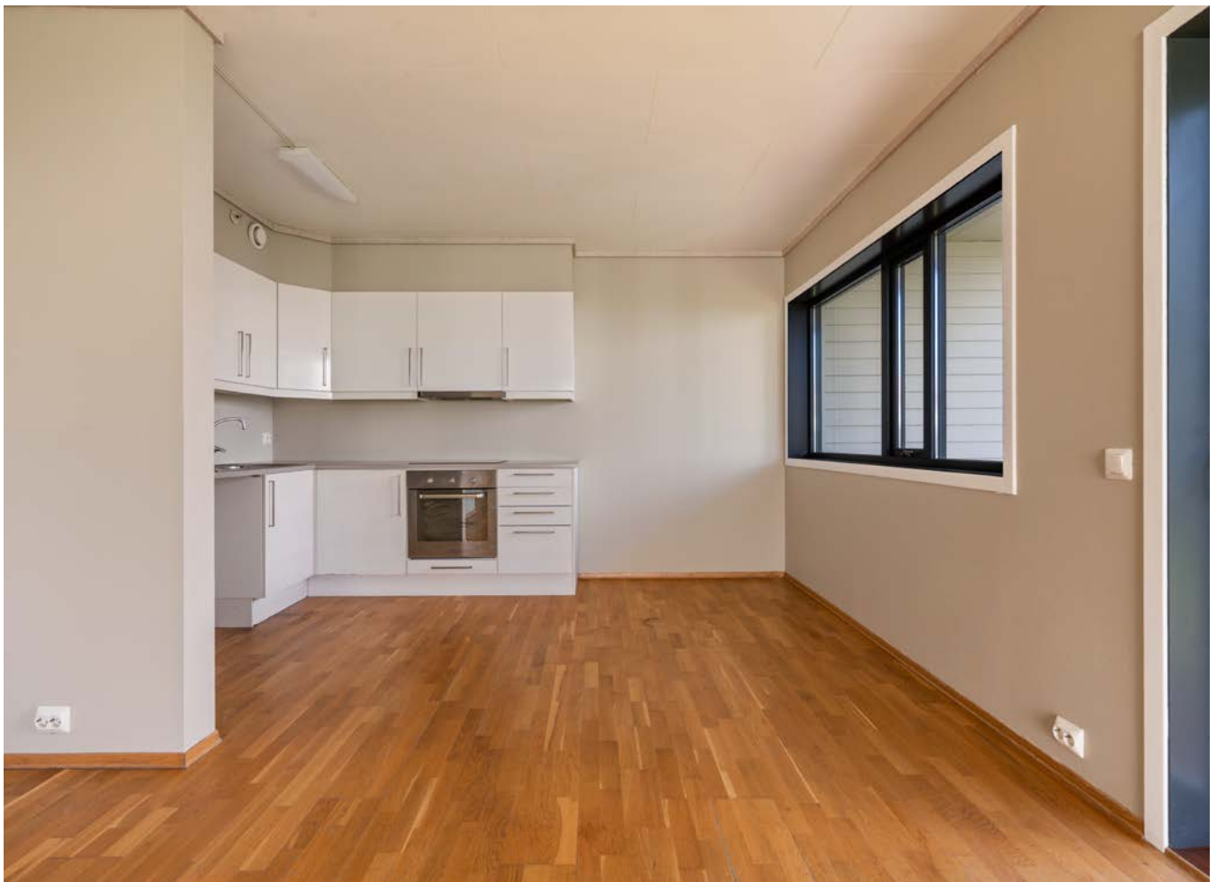
Delvis åpen stue - kjøkkenløsning