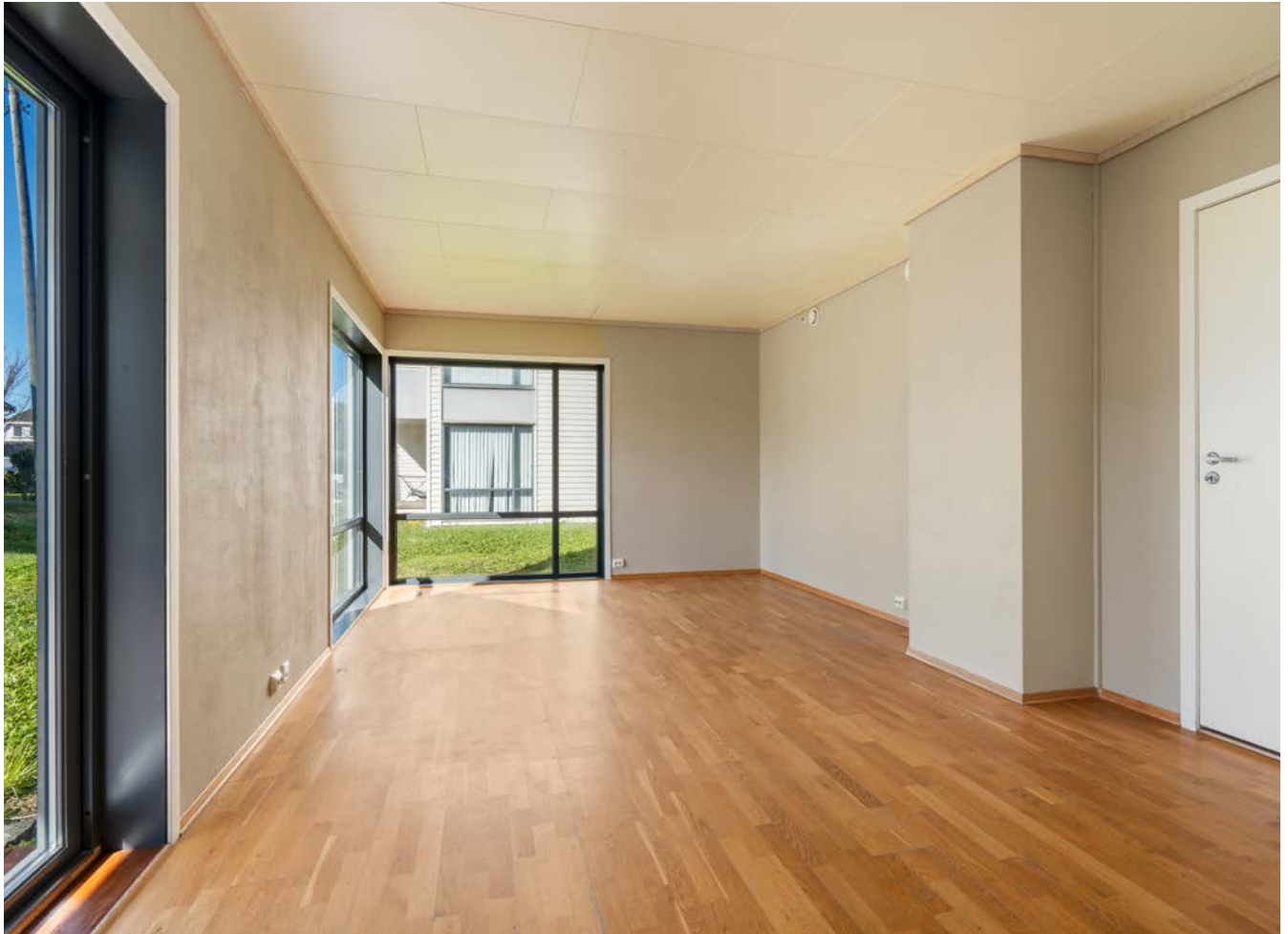
Rikelig med plass til sofagruppe og spisestue