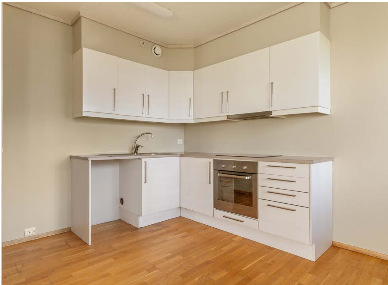
Kjøkkenen med god skap og benkeplass. Opplegg for oppvaskmaskin. Integreert komfyr - platetopp