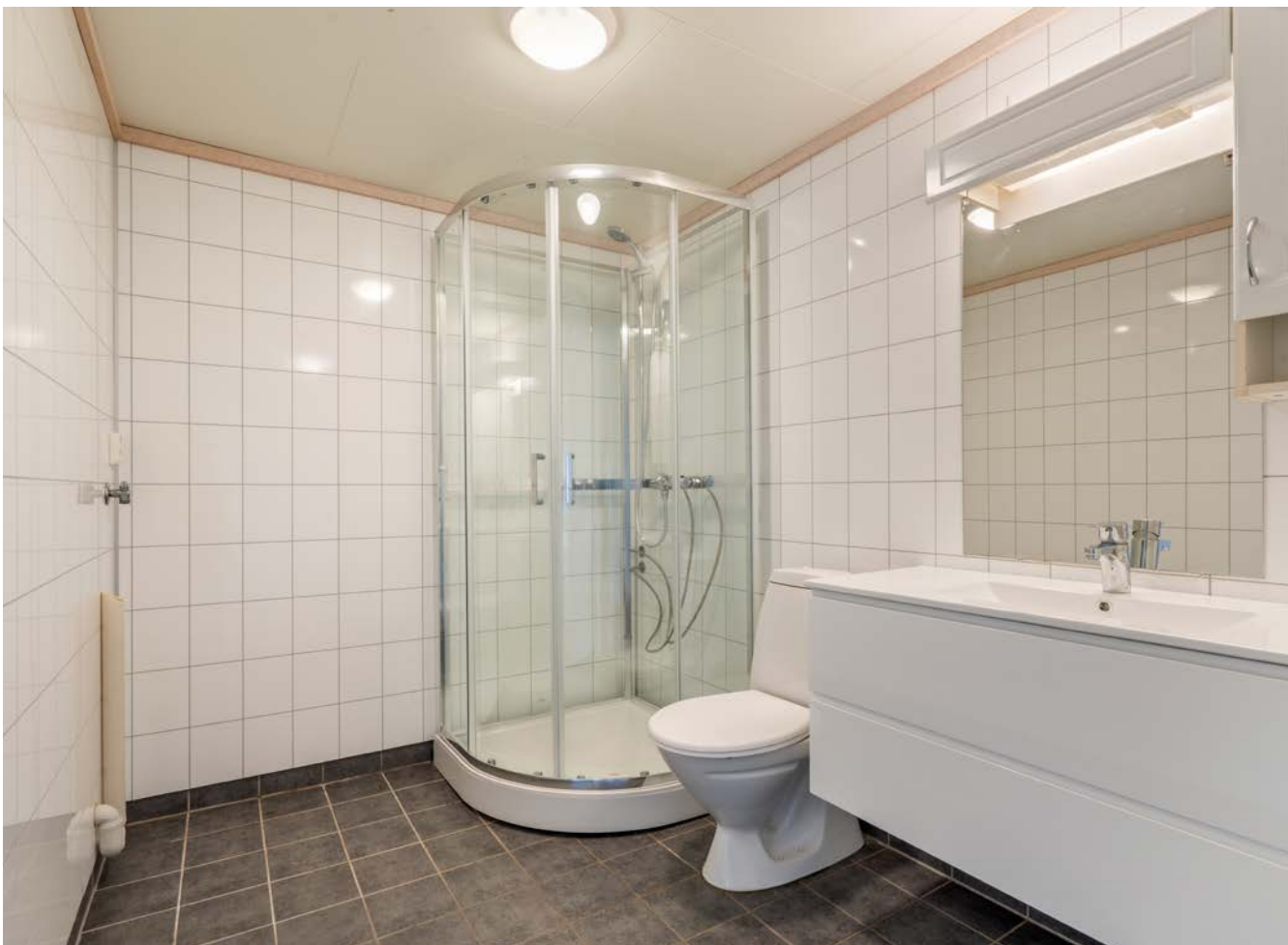
Bad/wc med dusjkabinett, varmekabler og opplegg for vaskemaskin