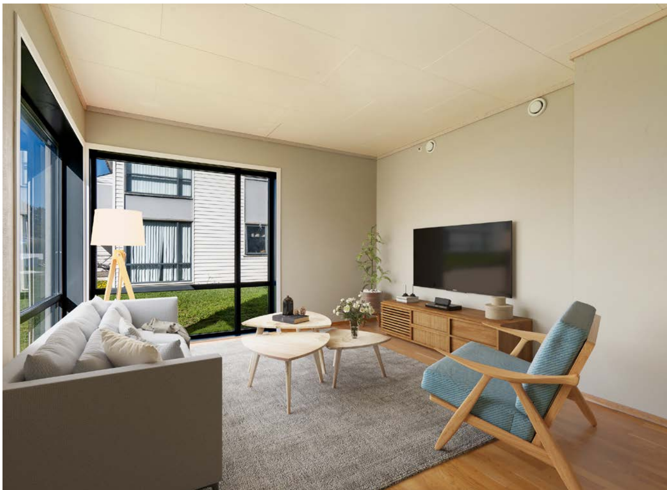
Lys stuekrok med vinduer mot sør og vest