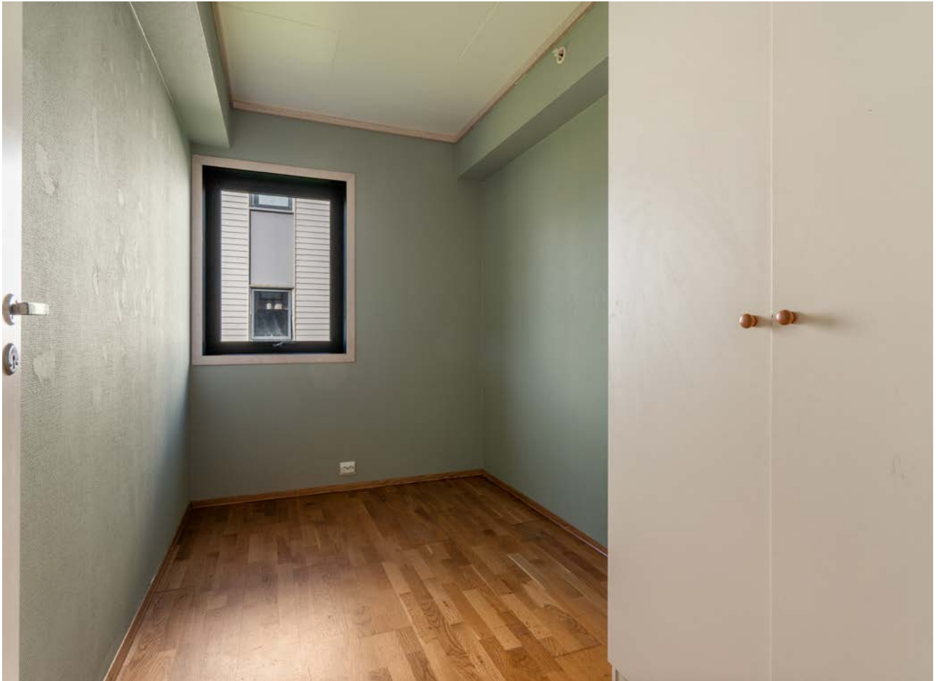
Soverom 3 med skaplass