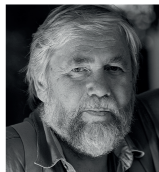
Tor Åge Bringsværd 1939 - 2025