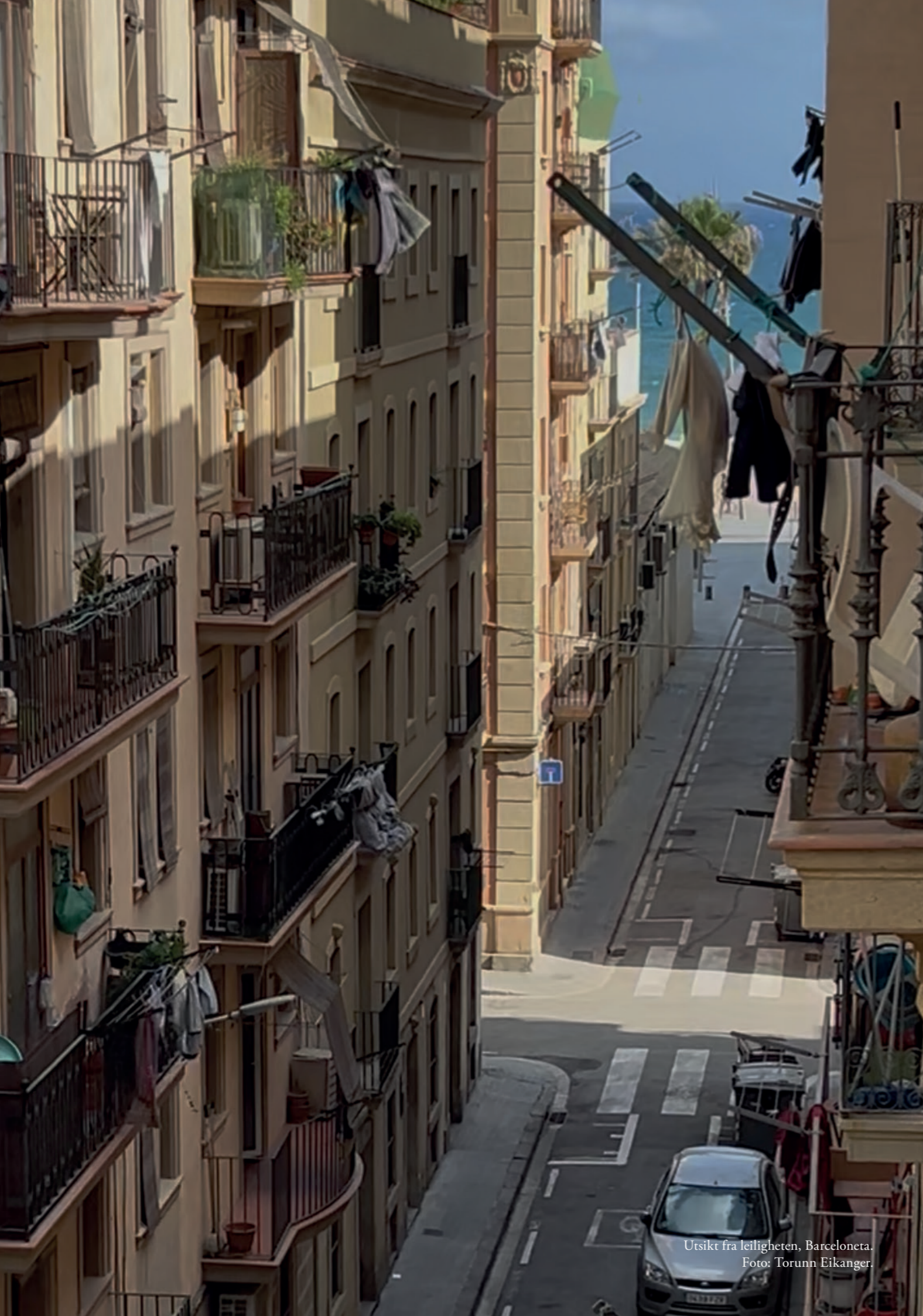
Utsikt fra leiligheten, Barceloneta.

Leiligheten ble leid ut i 47 av årets 52 uker.