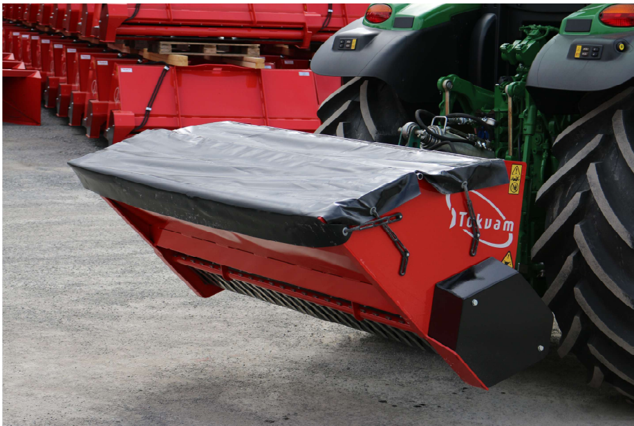
Fig. 1. Strømaskin med stengt presenning / Spreader with closed tarp

Fig. 1 og 2 viser hvordan strikkene fastholder presenningen både for transport og fylling. / Fig. 1 and 2 show how the rubber straps hold the tarp in place both for transport and for loading.