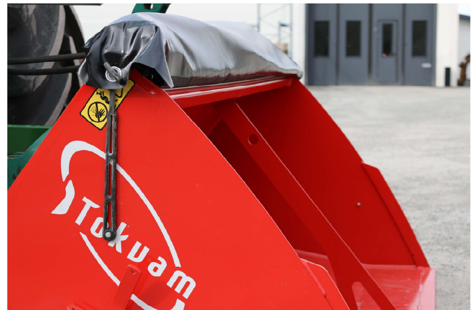
Fig. 2. Strømaskin åpen for fylling og fastholdt presenning / Spreader open for loading with the tarp held in place