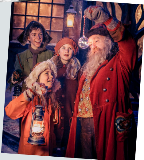
Kva heiter julenissen i TV-serien Snøfall ?