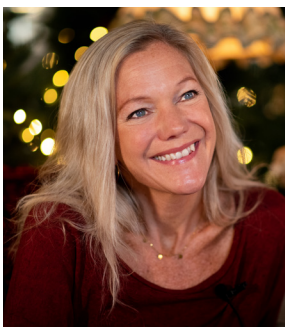
Maja Lunde er forfattar og har skrive boka Snøsøstera .