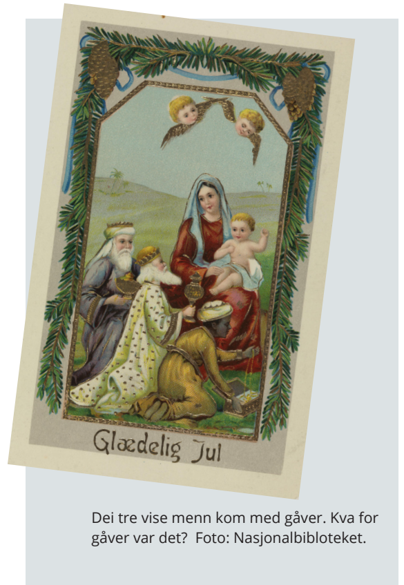
Dei tre vise menn kom med gåver. Kva for gåver var det?

Spørsmål 5: Sei namnet på eitt av dei sju slaga julekake ein må lage til jul, ifølge tradisjonen. Svar: Sandkake, peparkake, fattigmann, goro, berlinerkranser, krumkaker, serinakaker