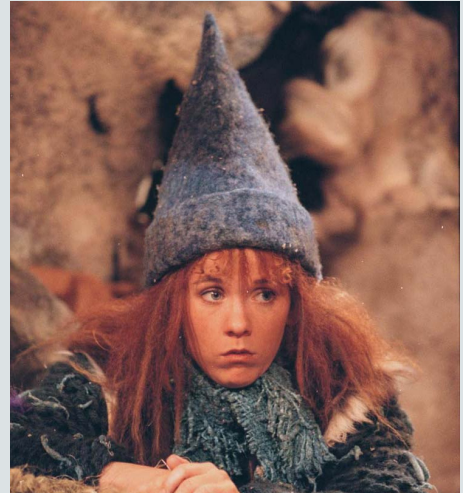
Kan du songen Turte syng i starten av Jul i blåfjell ?