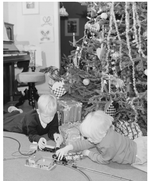
To barn som leiker med julegåvene dei har fått. Ser du kva det er?