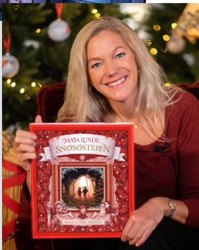
Hugsar du kva denne forfattaren heiter?