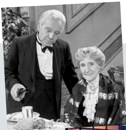
På veslejulaftan ser mange på denne sketsjen. Men kva heiter den?