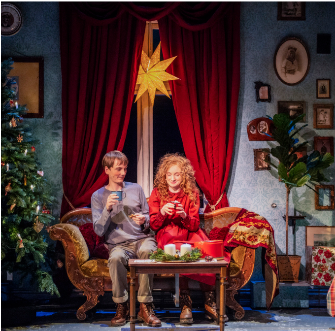
Utdrag 2: Scene 3 - Villa Kvisten

Eit fantastisk, julepynta hus openberrar seg.