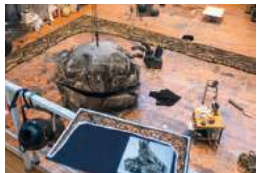
«Kostymet» til Steinknaskaren blir til på målar salen.