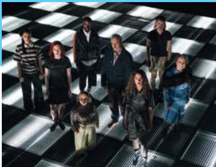
Heile ensemblet i Skodespelet samla på Scene 2.