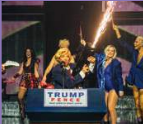
Donald Trump (Natalie Bjerke Roland) vil også vere med på Europavisjonar . «La makteliten blø» er bidraget hans.