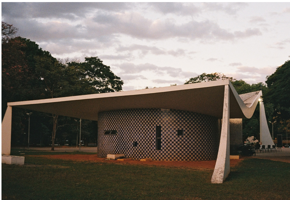
IGREJINHA NOSSA SENHORA DE FATÍMA