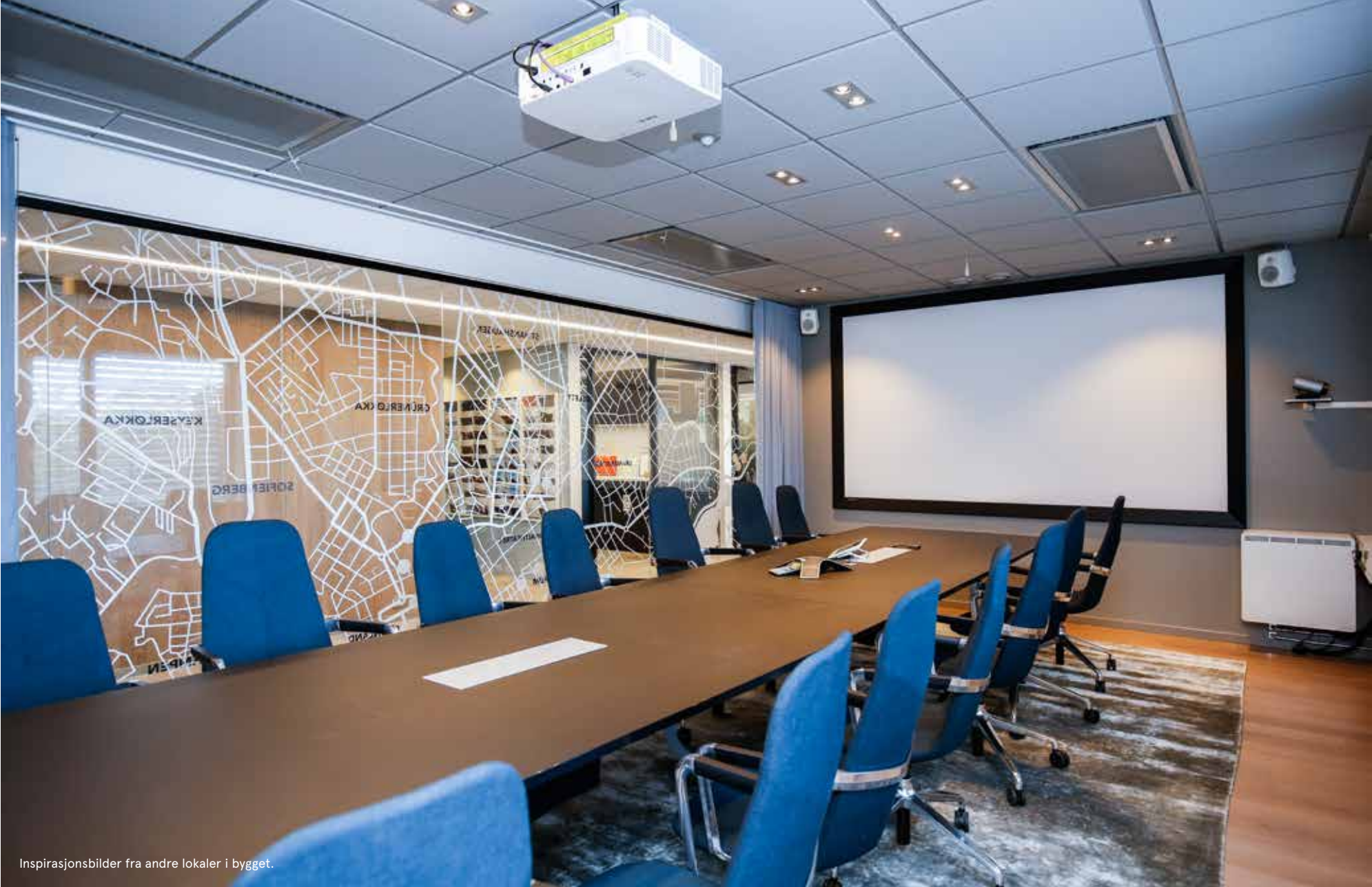
Inspirasjonsbilder fra andre lokaler i bygget.