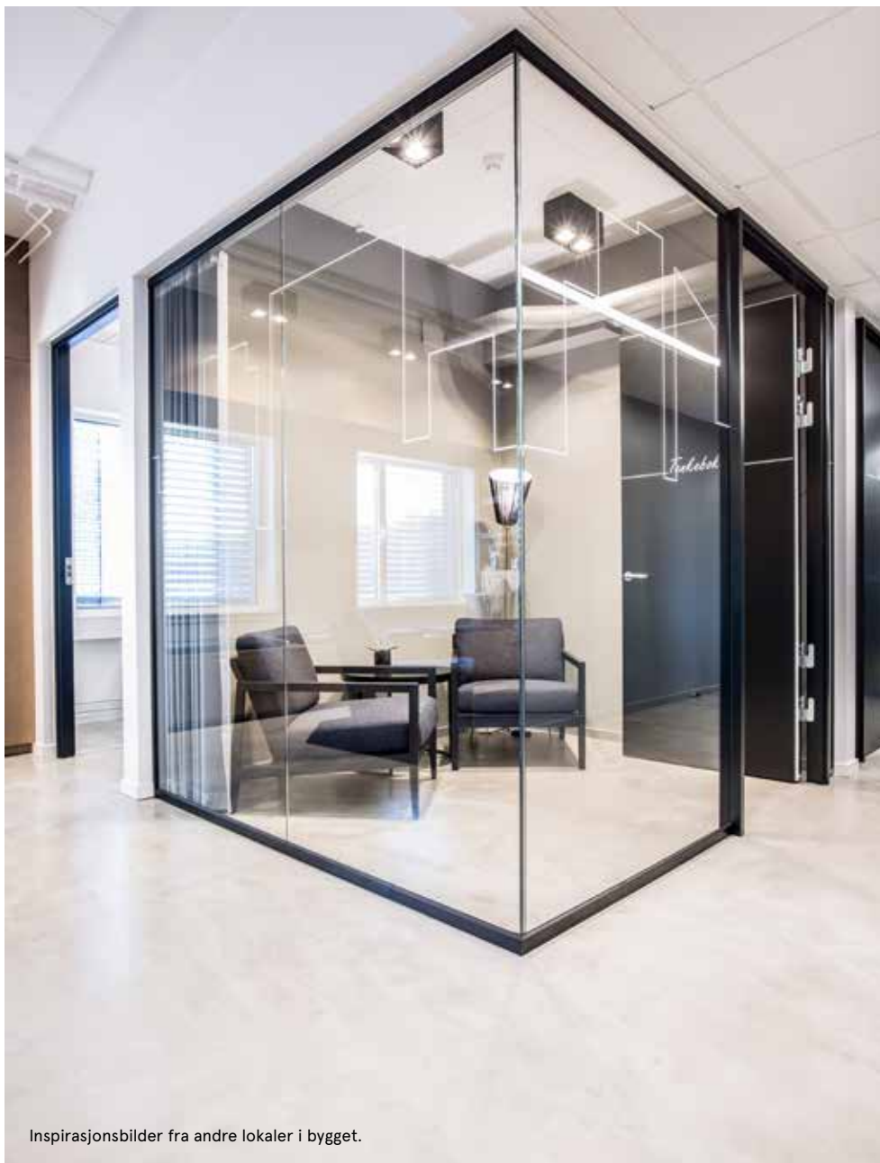
Inspirasjonsbilder fra andre lokaler i bygget.