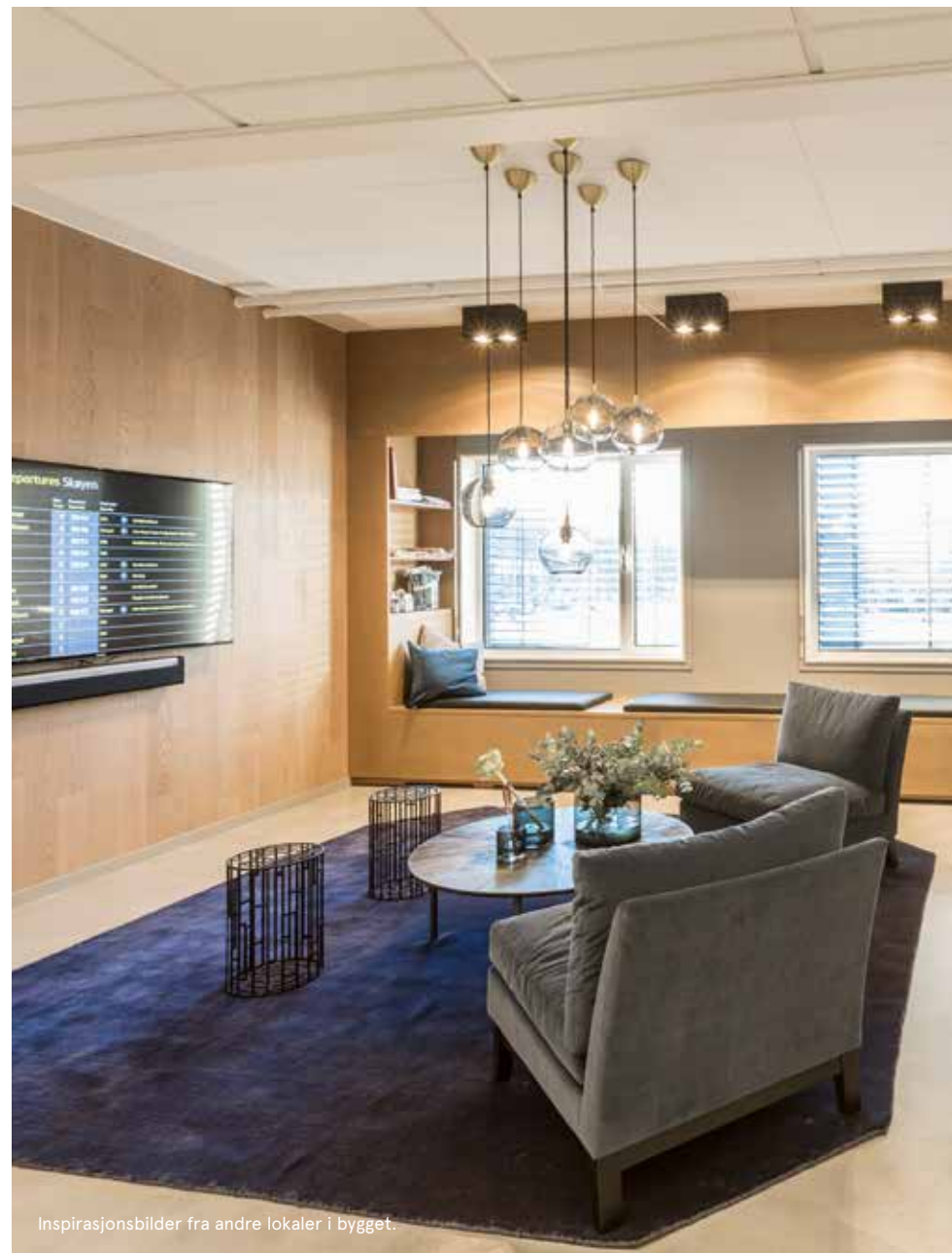
Inspirasjonsbilder fra andre lokaler i bygget.